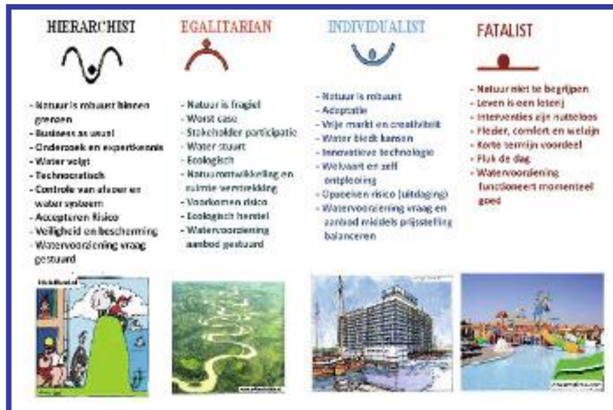
Afb. 1: De vier invullingen van de stereotiepe perspectieven op water en waterbeheer.

We onderscheiden drie niveaus: overtuigingen op wereldbeeldniveau (verwijzend naar fundamentele visies op water en de toekomst), op managementstijlniveau (wat willen we hoe bereiken) en op managementstijlprocesniveau (verantwoordelijkheden en besluitvorming). Omdat perspectieven in de praktijk niet stereotype zijn maar veelal bestaan uit interpretaties vanuit verschillende stereotype perspectieven, mochten respondenten per vraag nul tot en met vier antwoordopties aanvinken. Elke antwoordoptie (of combinatie) kreeg een code toegekend (variërend van 0-13), zodat achteraf geanalyseerd kon worden hoe vaak een antwoordoptie (perspectief) was gekozen. De vragenlijst is ingevuld door 152 respondenten vanuit verschillende professionele achtergronden (waterschappen, kennisinstituten, Rijkswaterstaat, ministeries, ngo's en overheden) met een gemiddelde leeftijd van 44 jaar. 76 Procent was man, 24 procent vrouw en respondenten waren gelijkmatig gespreid over Nederland (op