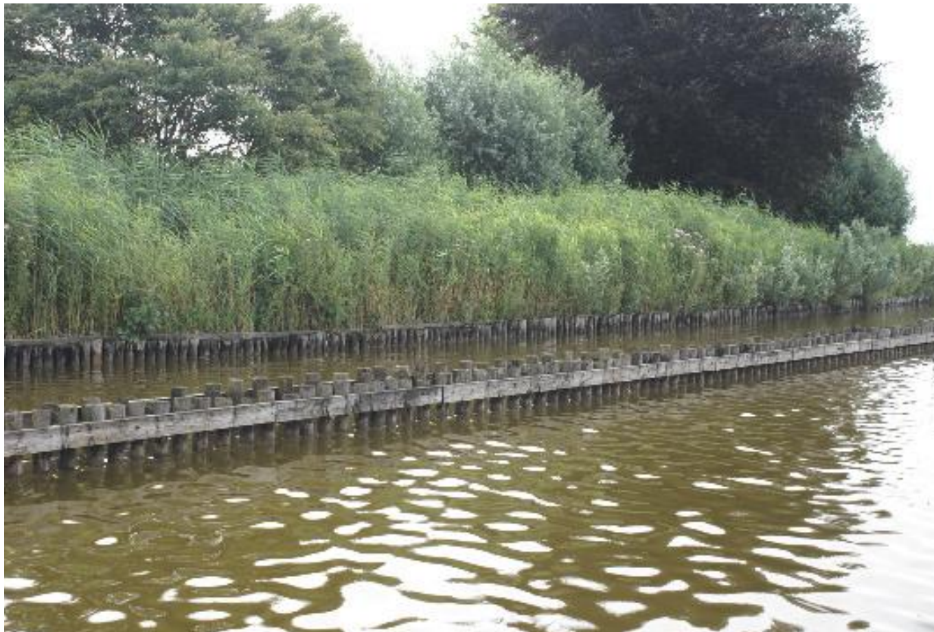
Natuurvriendelijke oevers hebben niet altijd de bedoelde uitstraling op de ecologische waterkwaliteit.

economische en sociale activiteiten. In zekere zin is dit vergelijkbaar met de in de KRW gehanteerde term 'goed ecologisch potentieel'.