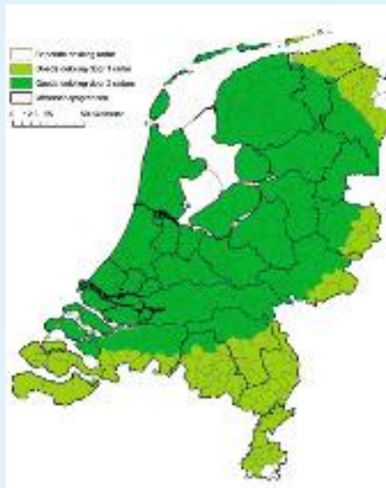
Afb. 1: Gemiddelde dekking van de Nederlandse radars.

Van de hoogwatervoorspelling en de daarvoor gebruikte radarneerslag is al sedert 2006 bekend dat in het noordoostelijke deel van Nederland minder goed wordt gemeten met de radars van De Bilt en Den Helder. Radars meten door de kromming van de aarde en de beperkte afstand tussen de uitrekenende wolken en het oppervlak, over een beperkte afstand. Dat is gemiddeld genomen circa 150 km 1) . De meting kan onder bepaalde omstandigheden enigszins worden uitgedoofd. Dat gebeurt bijvoorbeeld bij hevige neerslag dicht bij de radars. Daarom is het gunstig als een locatie door meer radars wordt gedekt. Afbeelding 1 presenteert de beheergebieden van de waterschappen en de gemeenten die door één of twee Nederlandse radars worden bemeten (licht- en donkergroene locaties) en ook de locaties met een beperkte dekking van de radars (witte locaties). Voor lichtgroene en witte locaties biedt het gebruik van buitenlandse radars meerwaarde. De grootste meerwaarde van het gebruik van de buitenlandse radars wordt bereikt voor het noordoosten van Groningen en het zuiden van Limburg. Dit wordt bevestigd door onderzoek waarin radarmetingen voor lange perioden zijn geanalyseerd 2) . Met een internationale samenstelling van een radarbeeld uit verschillende radars, aangeduid met 'composiet', kan men dit probleem zodanig aanpakken dat alle gebieden door minimaal twee radars worden bemeten.