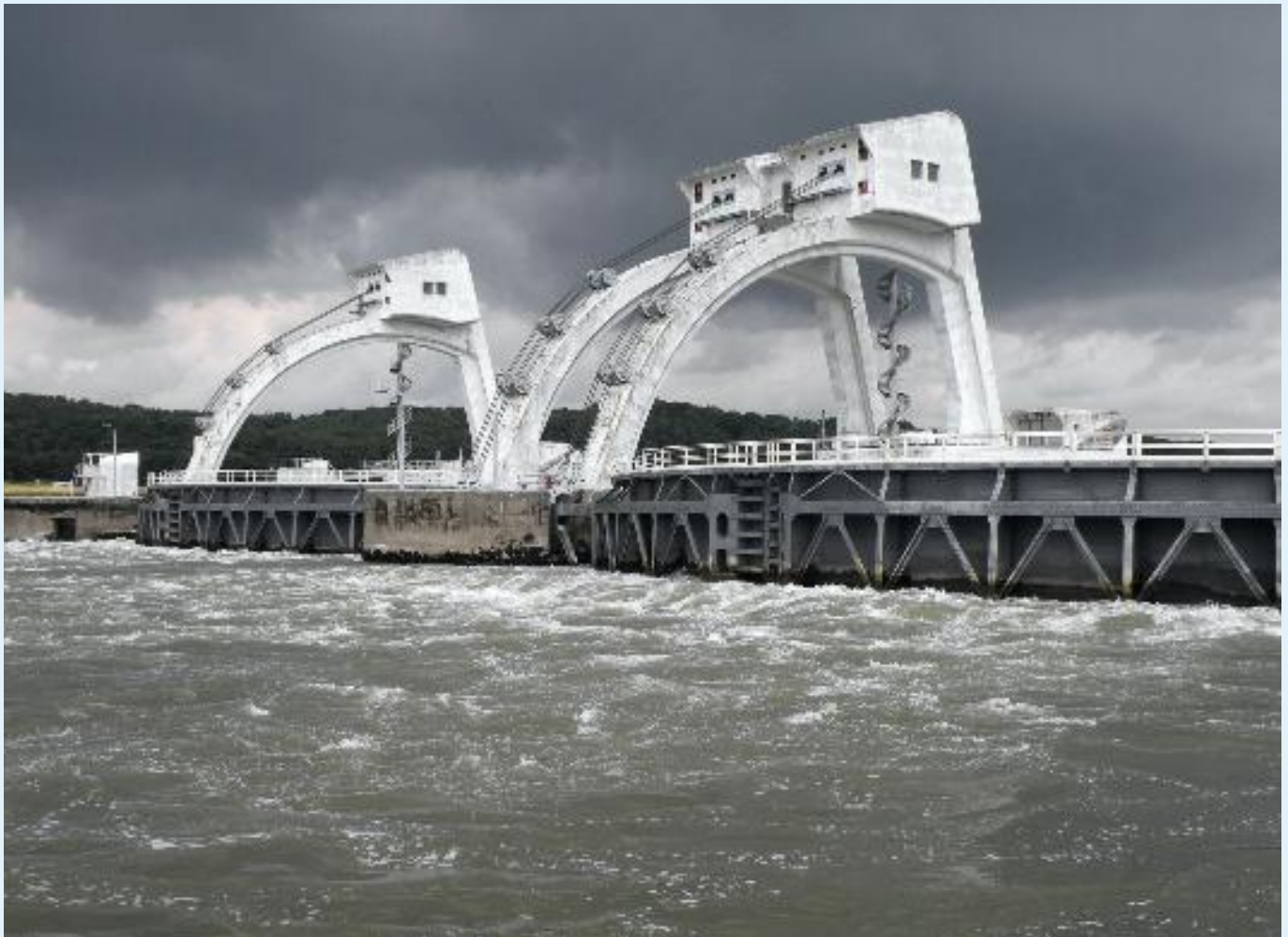
De stuw bij Driel, belangrijk voor de waterverdeling in Nederland.

De viewer waterverdeling is een toepassing op internet van Rijkswaterstaat voor de ontsluiting en analyse van modelresultaten van het Nationaal Hydrologisch Instrumentarium (NHI). Rijkswaterstaat krijgt met de viewer inzicht in de samenhang van de watersysteemdelen in het geheel, waardoor ook het beleid en maatregelen een betere samenhang krijgen. Rijkswaterstaat gaat de viewer gebruiken bij het beantwoorden en onderbouwen van vragen voor beleid en beheer voor toekomstig waterbeheer. De analyses leveren ook informatie op voor de verbetering van het NHI. Voor regionale waterbeheerders is het belangrijk om op de hoogte te zijn van dit instrument, omdat hiermee vragen sneller en duidelijk beantwoord kunnen worden.