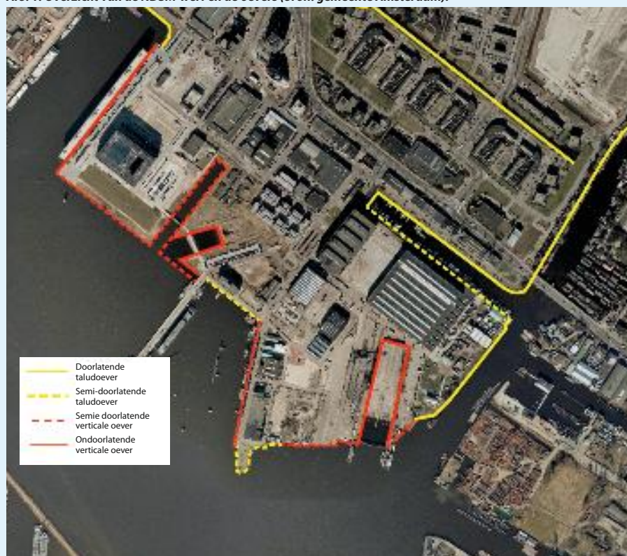
Afb. 1: Overzicht van de NDSM-werf en de oevers.