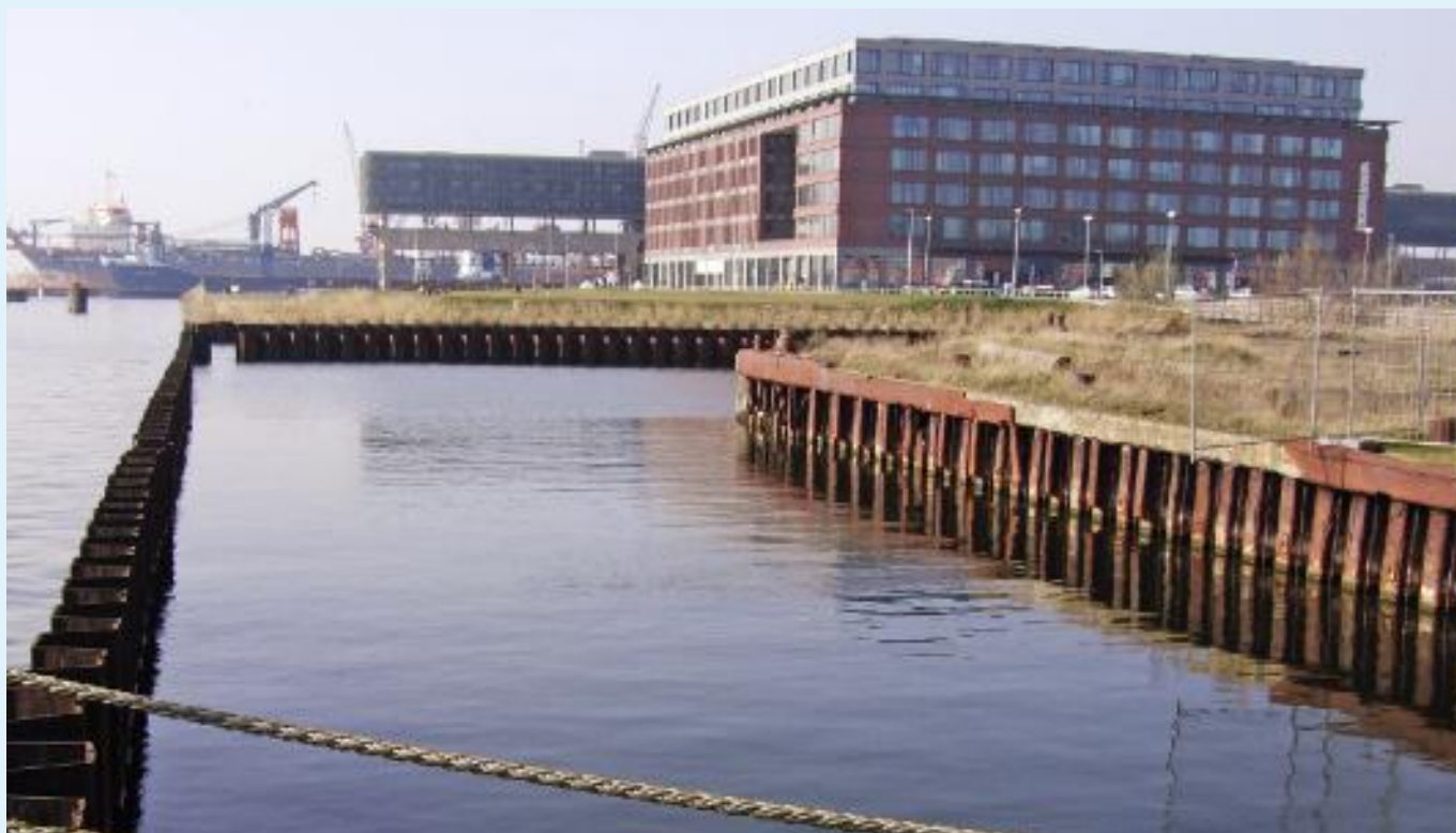
Gebiedsontwikkeling in het westelijk deel van de NDSM-werf.

een gering effect, omdat het water door de matig doorlatende bodem moeilijk naar de grindkoffer toe kan stromen. Bovendien is deze optie ongewenst voor de bewaker van de grondwaterzorgplicht (Waternet), omdat beheer en onderhoud nodig is.