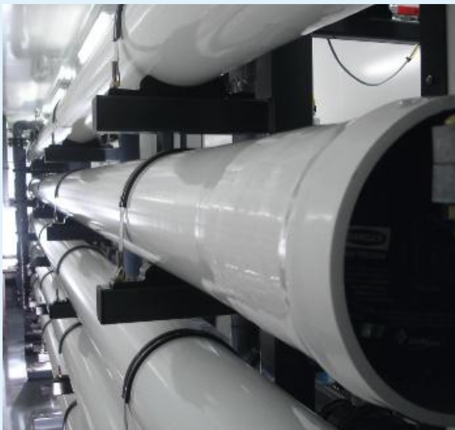
RO-proefinstallatie van Noardburgum in een zeecontainer.

Verstopping van de injectieput is in theorie te verhelpen door regeneratie met zoutzuur. De ervaringen hiermee in Zevenbergen waren niet positief: zeer grote hoeveelheden zoutzuur moesten worden geïnjecteerd om de putverstopping te verhelpen. Voorkomen van kalkneerslag is dus beter dan genezen. Dit kan bijvoorbeeld door toevoeging van het zwakke zuur CO 2 aan het te injecteren concentraat. CO 2 -dosering wordt momenteel getest in Zevenbergen. Een ander aandachtspunt in het proefproject Zevenbergen was boor, dat veelvuldig voorkomt in hoge concentraties in brak grondwater en gemakkelijk membranen kan