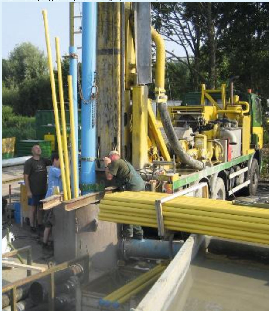
Inbouw van de pompput in de pilot Zevenbergen (Brabant Water).