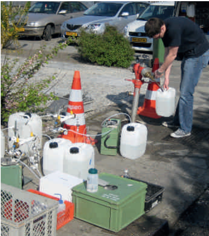
De bemonstering van 120 L drinkwater met een ultrafiltratie unit gebeurde op locatie door Bioclear en Oasen.