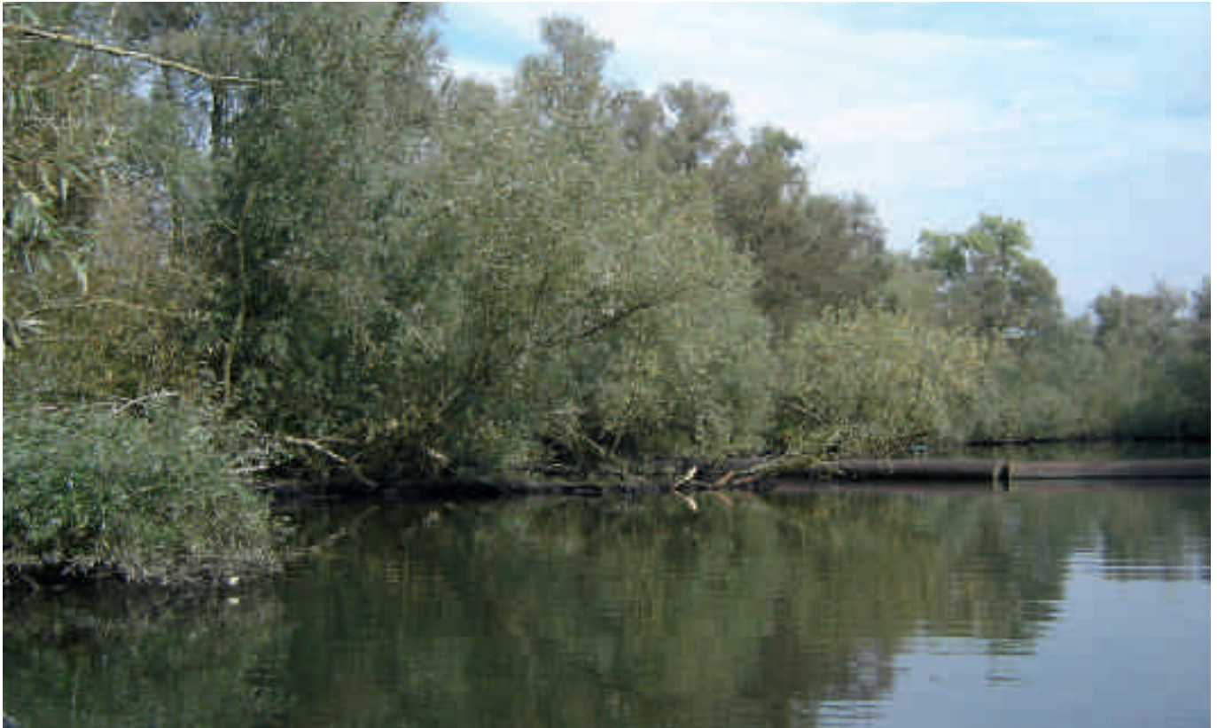
Brabantse Biesbosch, Gat van de Kielen.

aangetroffen die indicatief zijn voor brakke omstandigheden. In beide gevallen (litoraal en profundaal) is de score voor de deelmaatlat zoet water daarom 1,0 (zie hiernaast). In het litoraal van de Hollandsche IJssel zijn drie soorten gevonden die indicatief zijn voor brak water: Gammarus duebeni , Hypania invalida en Paranais litoralis . Het monster voldoet met een score van 0,81 echter nog wel aan de voorwaarde voor zoet getijdenwater.