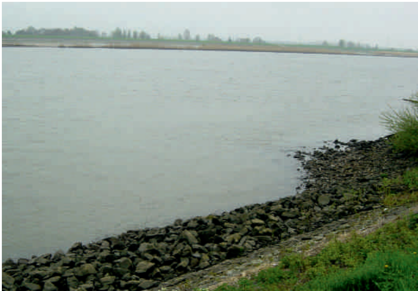
Hollandsche IJssel bij Moordrecht (foto: Rijkswaterstaat, Arie Naber).