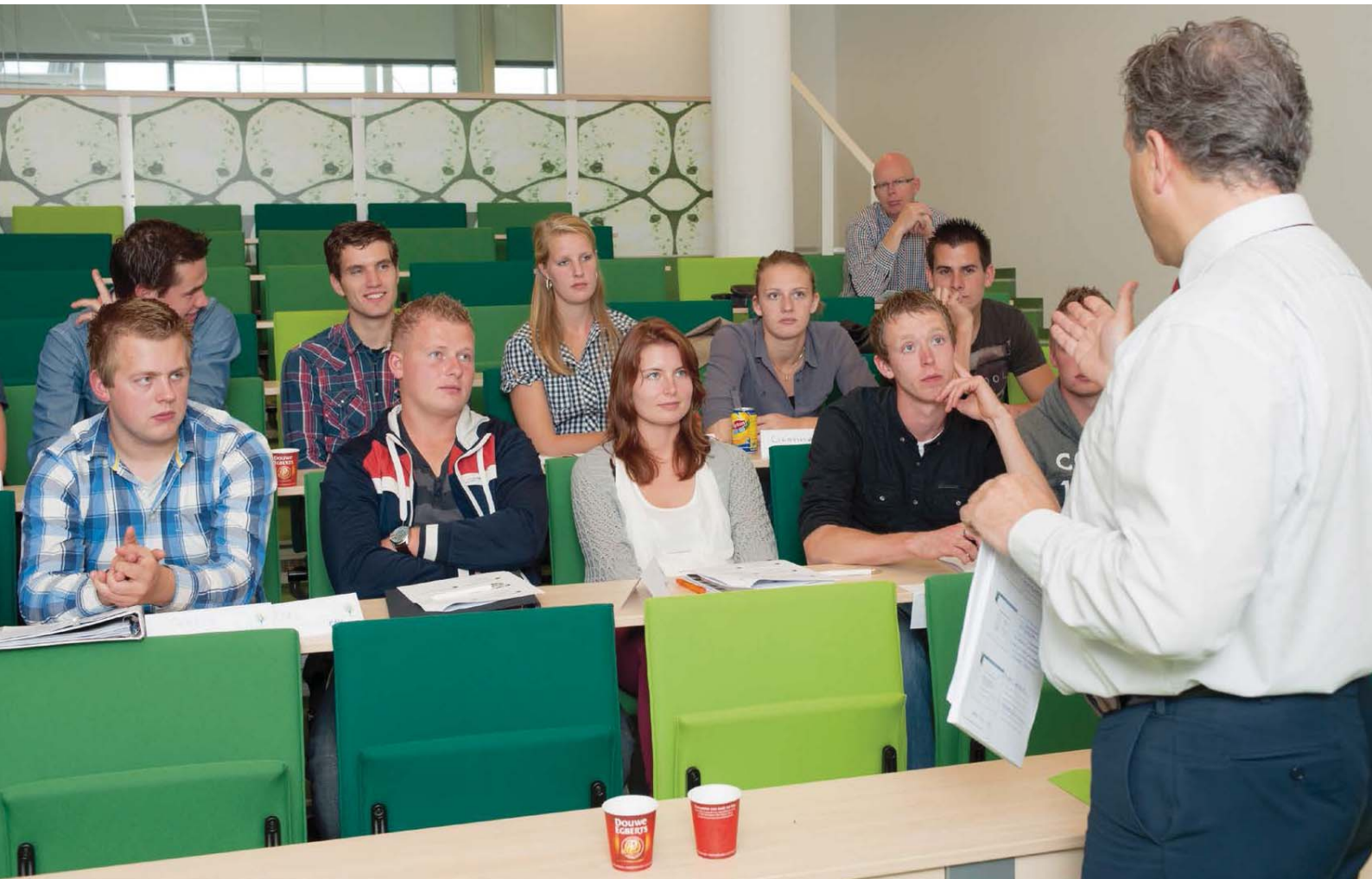
Taalontwikkeling vergt oefening, herhaling en routine, en daarmee aandacht in alle vakken in het hbo

ker ontving het advies in haar functie van voorzitter van het Comité van Ministers van de Taalunie.