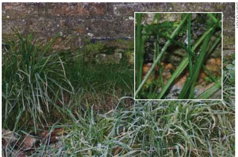
De foto toont het effect van een stenen muur op het microklimaat. Bij -5 °C was een smalle strook gras vlak voor de muur nog steeds niet bevroren. In deze strook werd een rups gevonden. Het relatief warme microklimaat zorgt ervoor dat de rupsen al bij een lage luchttemperatuur actief kunnen worden.

In de Krimpenerwaard konden nog geen rupsen gevonden worden in de periode van mei tot juli. Dit heeft er deels mee te maken dat de vegetatie op de klassieke vindplaatsen dan veel te hoog is. De rupsen hebben een lage vegetatie van grassen nodig. Daarom speelt eutrofiëring (toevoer van een overmaat aan voe-