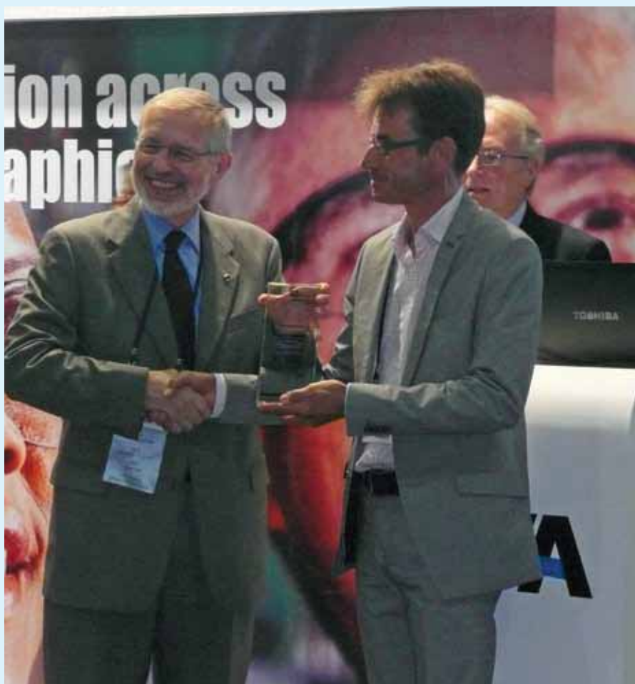
Uitreiking van de IWA Sustainability Award 2012.

De winning van biogas bij het zuiveren van