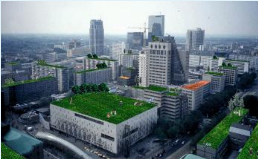
Impressie van groene daken in het centrum van Rotterdam.

Een belangrijk knelpunt dat uit de evaluatie naar voren kwam, is de bereikbaarheid van de waterwoningen. Parkeren voor de deur is veelal lastig te realiseren. Aangeraden wordt om al in de bestemmingsfase een dubbelbestemming op de waterkavels op te nemen in het bestemmingsplan ('wonen' en 'water').