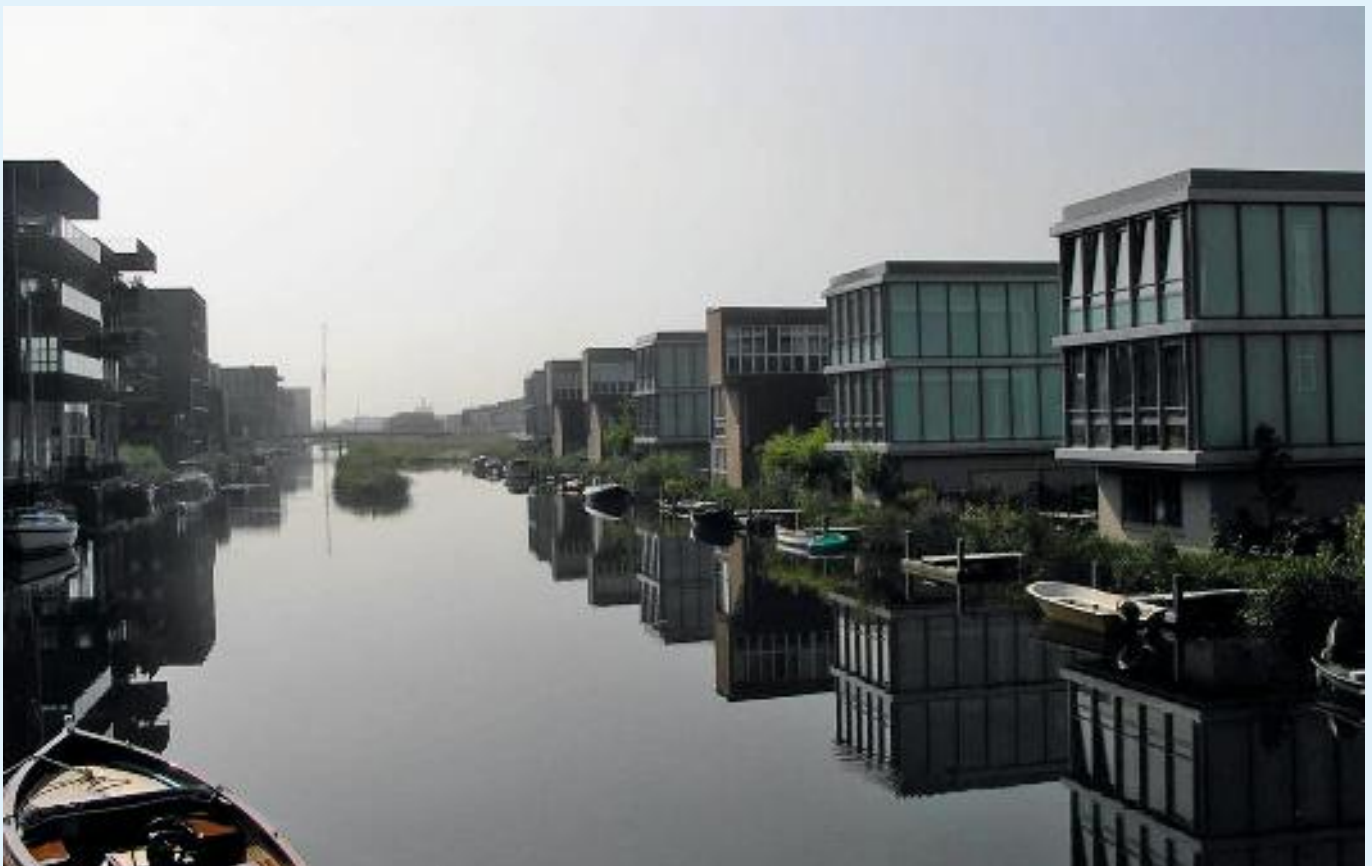
Waterwoningen in Amsterdam (IJburg).

De aansluitingen van gas, licht, water en riolering zullen flexibel moeten zijn en bestand tegen continue schommelingen. De aan- en afvoerleidingen zullen tegen zowel hoge als lage temperaturen beschermd moeten worden. Ook moet rekening worden gehouden met de bewegelijkheid van waterwoningen vanwege het variërende waterpeil en de golfslag.