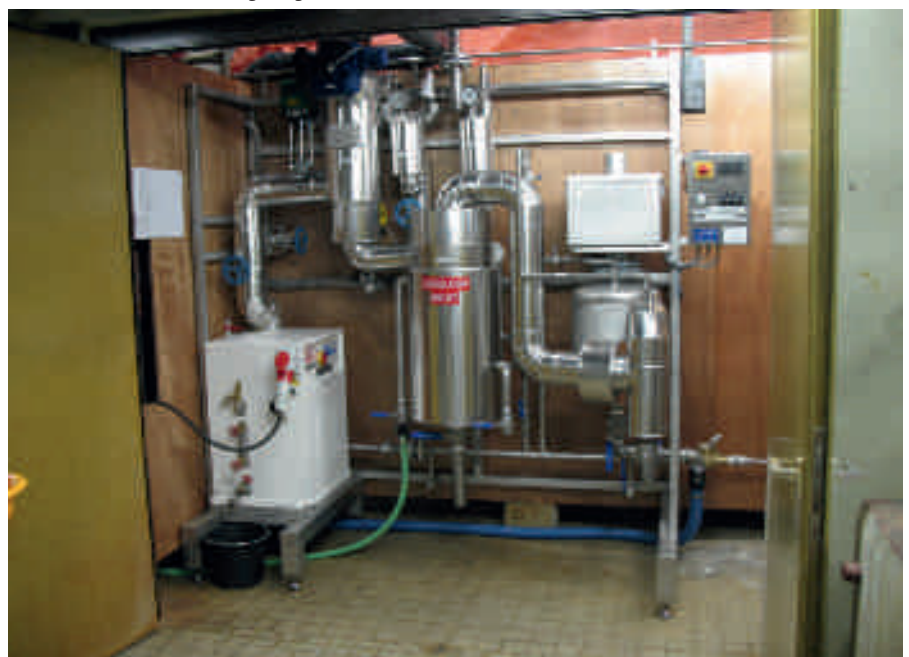
Pilot thermische slibontsluiting Hengelo.

Doel van het project was het vaststellen van het effect van thermische drukhydrolyse op de anaerobe afbreekbaarheid van secundair