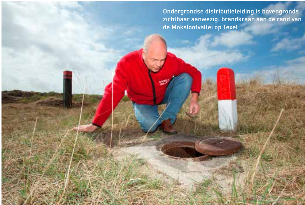
Ondergrondse distributieleiding is bovengronds zichtbaar aanwezig: brandkraan aan de rand van de Mokslootvallei op Texel