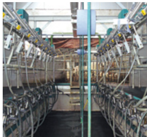
Met de Dematron 70 kun je de melkgift in de melkstal bekijken en hij is te koppelen aan een managementsysteem.

je hem onderhangt, waarna de pulsatie automatisch begint. In dat geval heb je de startknop dus niet nodig om een melkbeurt