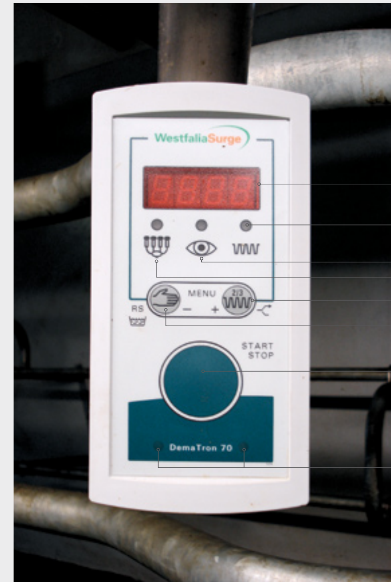
Led: Led display Led 1: Handbediening (rood) Led 2: Melkstroom (geel) Led 3: Pulsatie/stimulatie (groen) T1: Start/stop T2: Herstart/aanpassing stimulatie T3: Start handbediening L: Signaallicht