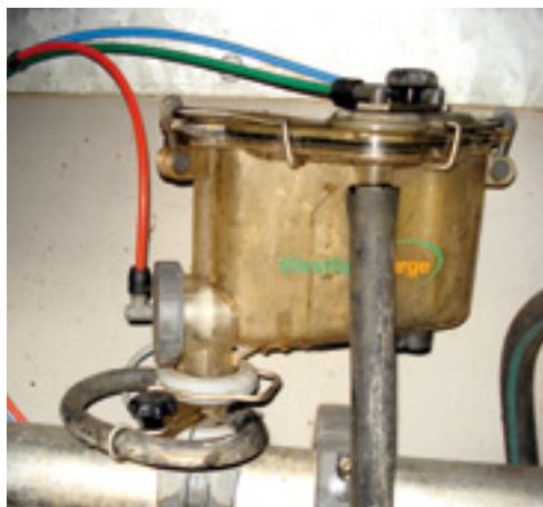
De Metatron MB meetbox zorgt voor de melkmeting van de Dematron 70.

alle melkstellen om op start te drukken. Als optie is er de EasyStart. Dan hoeft je het melkstel alleen maar op te pakken voordat