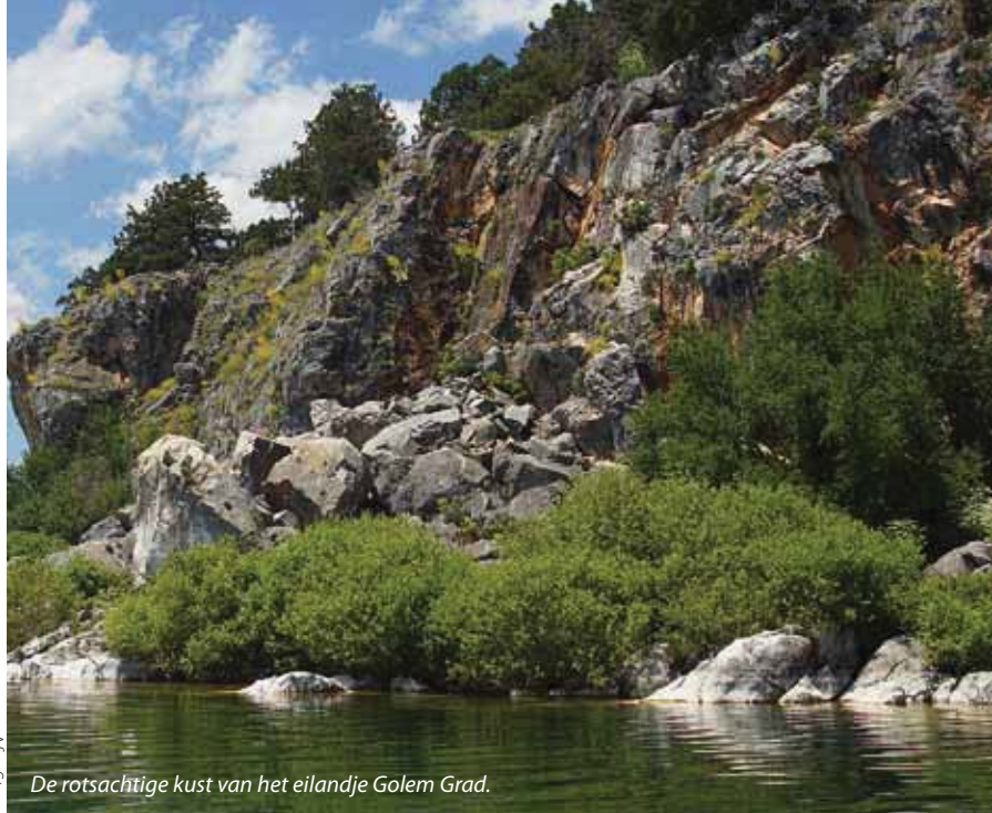
De rotsachtige kust van het eilandje Golem Grad.

Na een poos bereiken we een brede serene vallei vol met bloemen, Pole Doline genaamd, en een klein kerkje: Sveti Spas. In de verte horen we gedonder; mocht het weer slecht worden dan is dit kleine gebedshuis een ideale schuilplaats. Vlakbij bevindt zich een grote poel helemaal bedekt met witte ranonkels. Van een afstand lijkt het wel een fata morgana. Delicate witte vogelmelkbloempjes, forse witte klavers en tal van andere planten verfraaien het landschap. De zuidelijke luzernevlinder kan men niet verwarren met de oostelijke of onze 'eigen' gele luzernevlinder daar de laatste twee hier niet voorkomen. Een heel gepuzzel blijven wel de spikkeldikkopjes die met enkele soorten zijn vertegenwoordigd in Galičica Nationaal Park. We identificeren bretons, geelband- en voorjaarsspikkeldikkopje en aardbeivlinder. Overdag actieve nachtvlinders als bruine daguil en boterbloempje passeren ons regelma-