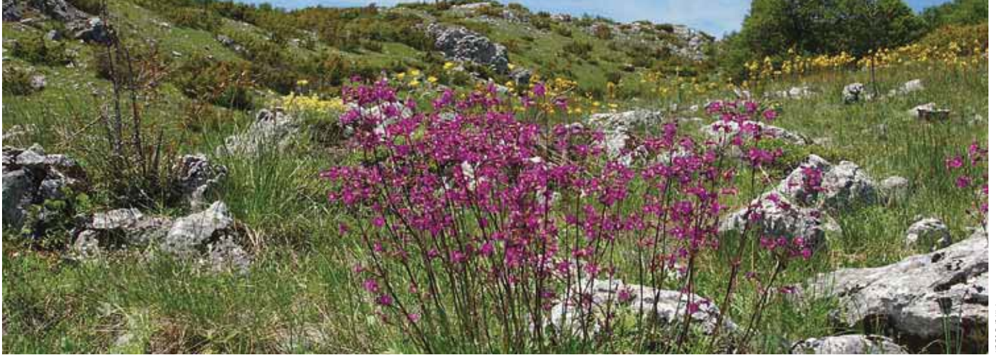
Bloemenpracht langs de Dva Jabori-trail