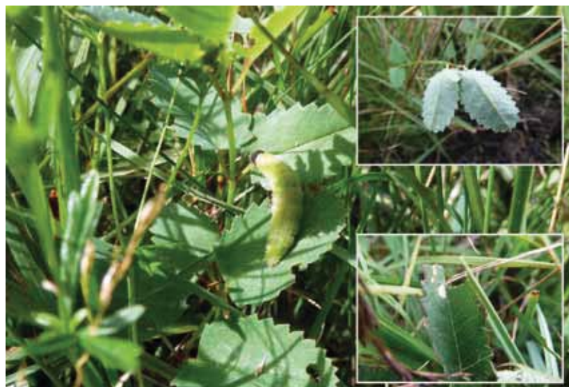
Aardbeivlinderrups op grote pimpernel. Er zijn zowel vraatsporen aanwezig (onderste inzetfoto) op deze plant als spinselnesten (bovenste inzetfoto).

Dat de aardbeivlinder wel degelijk nieuw leefgebied kan koloniseren, is ook vastgesteld in het eerder genoemde natuurontwikkelingsterrein: het gehele terrein is hier gekoloniseerd door de soort. Maar hij is in het voorjaar van 2012 ook buiten dit natuurontwikkelingsterrein, in de Olde Maten waargenomen. Het betrof drie exemplaren die minstens 130 meter afgelegd moeten hebben door ongeschikt leefgebied en tevens een breed kanaal en aanliggende weg hebben moeten