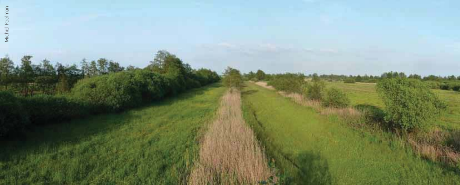
Panorama van het leefgebied van de aardbeivlinder in het karakteristieke slagenlandschap van de Olde Maten.

tal toe (figuur 1). In 2009 is de soort voor het eerst vastgesteld in het naastgelegen natuurontwikkelingsterrein (zie overzichtskaart). Hier heeft in 1997 maaiveldverlaging plaatsgevonden door het verwijderen van de voedselrijke bovengrond met als doel blauwgrasland te realiseren. In overleg met De Vlinderstichting is hier in 2010 een soortgerichte vlinderroute uitgezet, gericht op de aardbeivlinder. Opvallend is dat de zilveren maan dit terrein (op een enkele losse waarneming na) nog niet gekoloniseerd heeft, terwijl hij wel veelvuldig voorkomt in het blauwgraslandreservaat.