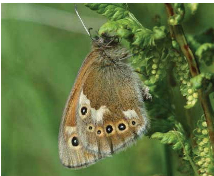
Veenhooibeestje in het Fochteloërveen.

Door verdroging, vermesting en versnippering van leefgebieden zijn veel populaties in de afgelopen