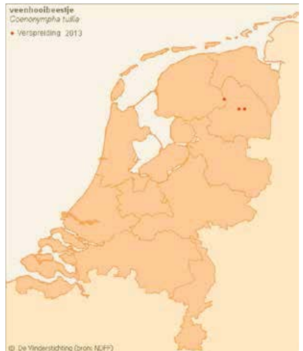
Figuur 1: Verspreiding van het veenhooibeestje in Nederland in 2013.

decennia uit Nederland verdwenen. In de jaren negentig zijn in verscheidene gebieden vernattingmaatregelen uitgevoerd om de verdroging tegen te gaan met als uiteindelijk doel het behoud en herstel van het overgebleven (hoog)veen (Wynhoff, 1998). Juist ook deze vernatting heeft ervoor gezorgd dat het veenhooibeestje uit verschillende gebieden is verdwenen. Plotselinge peilverhoging heeft er in die tijd voor gezorgd dat het leefgebied met de pollen eenarig wollegras werd overspoeld, waarbij de rupsen zijn verdronken (Joy & Pullin, 1997). Dit geldt waarschijnlijk voor het Holtveen en het Wooldse veen. In het Fochteloërveen hebben vernattingmaatregelen wel een positieve uitwerking gehad op de aanwezige populatie in het gebied, omdat die daar gefaseerd in compartimenten is uitgevoerd.