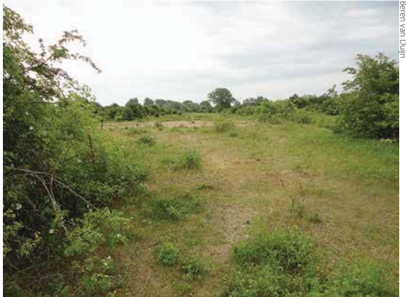
Beren van Duijn

De exacte uitzetlocaties zijn gekozen aan de hand van de aanwezigheid van zandig, kort grasland, nectarplanten en solitaire struiken. Dit is op de foto hierboven te zien. Zowel de Groenlanden als de Millingerwaard worden jaarrond extensief begraasd door wildlevende paarden en runderen. Eitjes, rupsen en poppen heb-