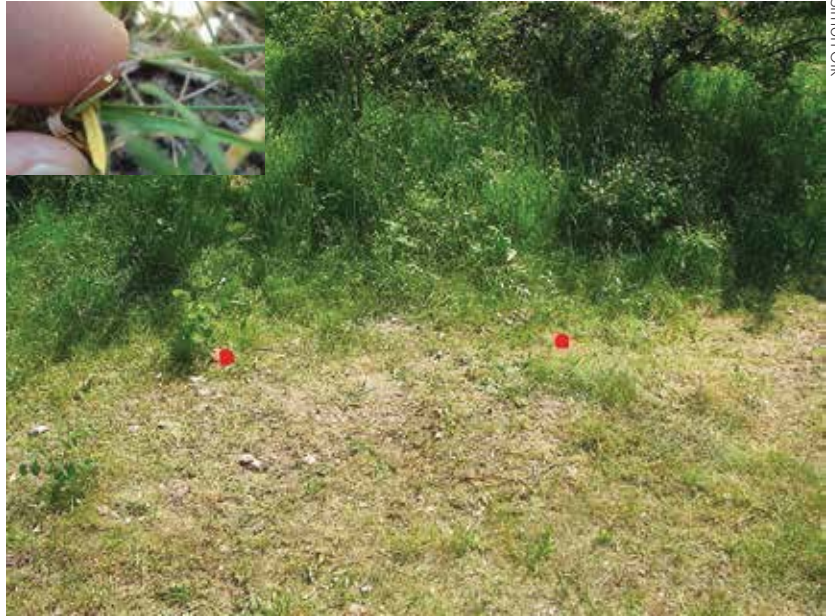
Twee plekken waar eiafzet heeft plaatsgevonden. Precies op de overgang tussen droog en vochtiger grasland. Inzet: het eitje van de rechter locatie.