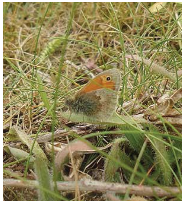
Beren van Duijn

Het hooibeestje is een kleine dagvlinder die meestal met de vleugels dicht in grazige vegetatie zit. De oranje kleur van de bovenkant van de vleugels valt bij het vliegen goed op.