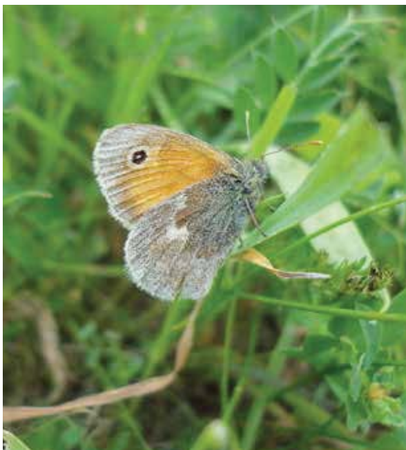
Beren van Duijn

Het is opmerkelijk dat een in Nederland algemeen voorkomende soort als het hooibeestje maar niet terugkeert. De vereiste habitat lijkt tegenwoordig meer dan ooit aanwezig. En hoogwatervrije plekken maken herkolonisatie na hoogwater mogelijk. Ook liggen er natuur-