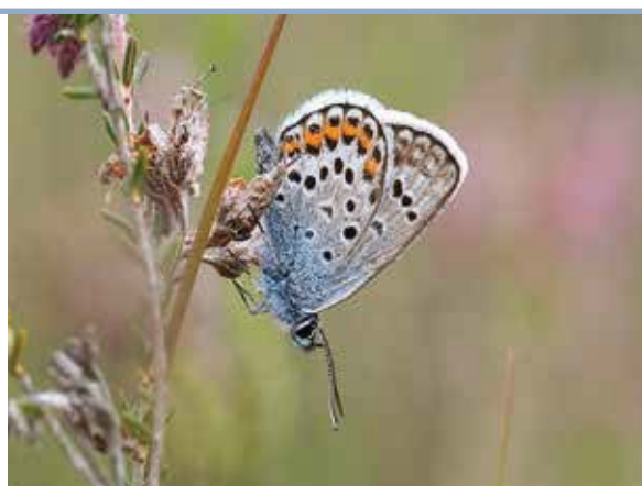
Chris van Swaay

Gemiddeld aantal vlinders per telling in de beste drie vlinderweken in de zomer (blauwe lijn). In de zomer van 2013 was het heideblauwtje extreem talrijk op een paar routes. Gebruiken we voor die weken de gemiddelde waarde van de vorige jaren voor deze soort, dan zou het gemiddeld aantal vlinders wel een stuk omlaag gaan (de dikke blauwe stip). Het blijft nog steeds een puike vlinderzomer, maar iets minder extreem dan de lijn suggereert.