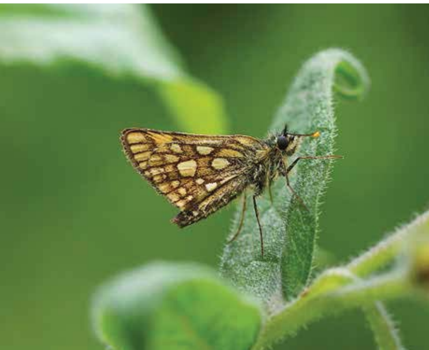
Bont dikkopje, De Scheeken.

De bijzondere leembossen vormen tezamen met de andere biotopen een gevarieerd mozaïeklandschap