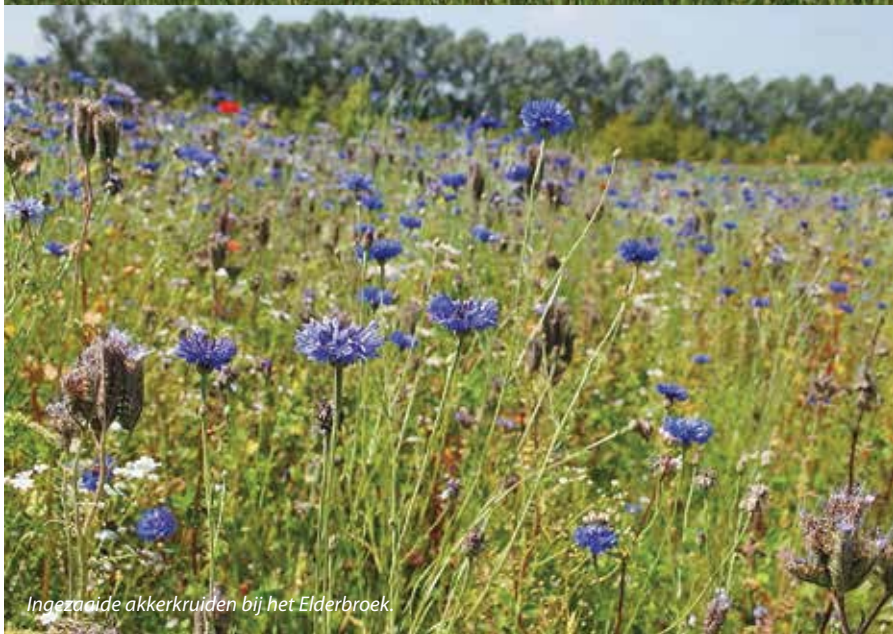
Ingezaaide akkerkruiden bij het Elderbroek.