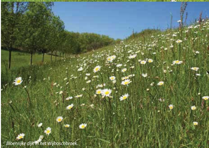
Bloerijke dijk in het Wijboschbroek.