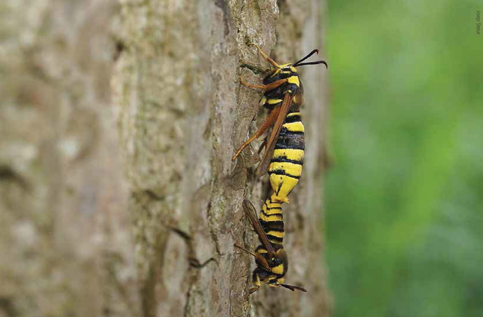
Hoornaarvlinders voelen zich thuis in de Schijndelse populierenweide.

(bij 's-Hertogenbosch aan de noordelijke rand van Het Groene Woud) worden omgevormd tot volwaardige blauwgraslanden waar het pimpernelblauwtje in de nabije toekomst leefgebied kan vinden (het project Blues in the Marshes, waarin ook De Vlinderstichting participeert).