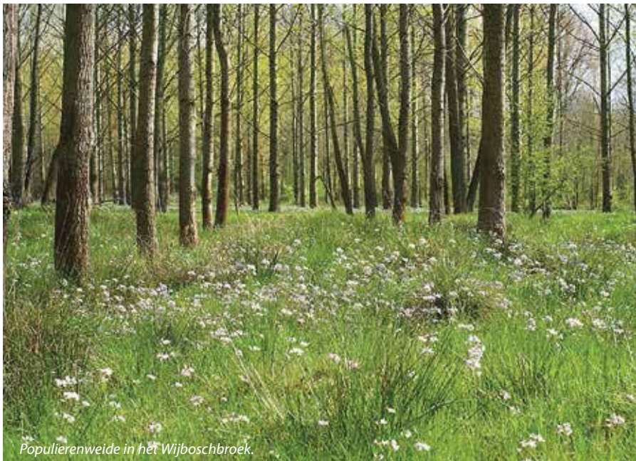
Populierenweide in het Wijboschbroek.