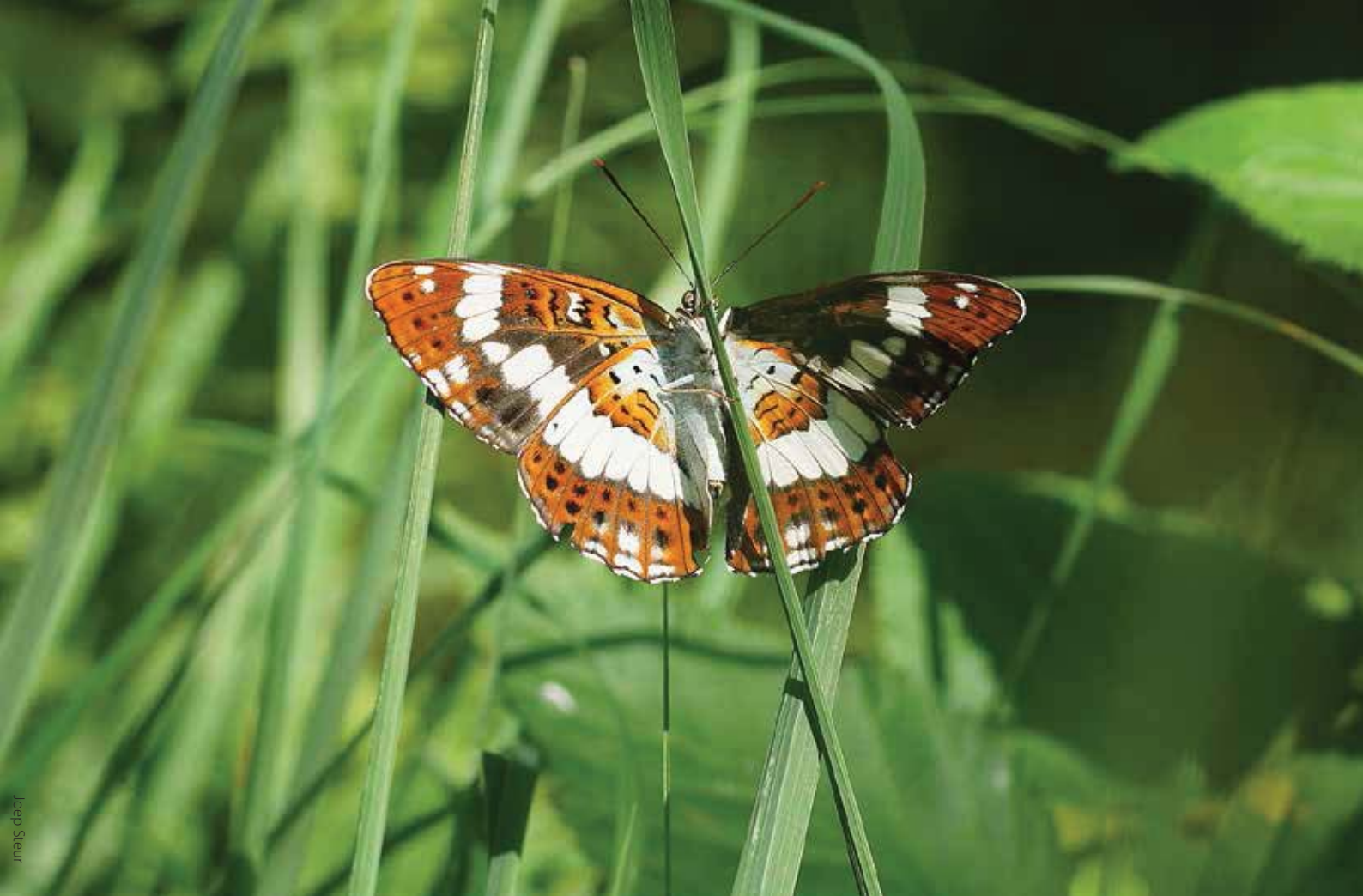
Kleine ijsvogelvlinder in de Geelders.

beeld bij het uitvoeren van vlindervriendelijke maatregelen door diverse betrokken terreineigenaren en NMC Schijndel. Ook hielp het boek geënthousiasmeerde particulieren bij het vlindervriendelijk maken van hun lapje grond. Er worden gratis begeleide vlinderwandelingen en nachtvlinderavonden georganiseerd. En er zijn vlinderwandelfolders van de in het boek beschreven gebieden uitgegeven en ook een grote vlinderposter van de gesignaleerde dagvlinders in Het Groene Woud. Voor basisscholen en jeugdnatuurgroepen in de regio is een digitaal lespakket samengesteld met de titel 'Vera de Vlinder'. Dit alles onder de paraplu van de zeer actieve Stichting Natuurprojecten Schijndel. Met al deze maatregelen hopen we de vlinders een solide basis te geven voor verder herstel in de toekomst en zal Het Groene Woud uiteindelijk nog een stuk groener worden dan het al was!