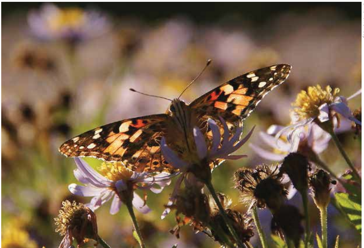
Distelvlinder: Afrikaanse migrant.