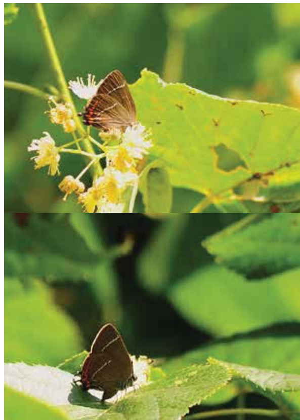
Iepenpage mannetje (boven) en vrouwtje (onder).

Is de iepenpage nu uit Tienvoor12!? Doel van deze campagne is te bereiken dat er van een soort meer dan tien populaties in Nederland zijn. In 2013 en 2014 zijn 37 vindplaatsen vastgesteld, maar dat zijn nog geen losse populaties. Waar de exacte grenzen van een populatie liggen, zullen we komende jaren moeten bepalen. We denken dat we in Limburg te maken hebben met twee metapopulaties en in de Achterhoek mogelijk één. Dat houdt deze soort voorlopig nog binnen de kaders van Tienvoor12! De zoekacties op de lijn Heerlen – Gulpen hebben helaas nog geen vlinders opgeleverd. Het vermoeden is dat de soort via Heerlen – Hoensbroek – Schinnen zich naar het noordwesten uitbreidt en mogelijk aansluiting vindt via Elsloo – Bunde – Maastricht. In de Achterhoek zijn bij benadering vijf kernen gevonden met iepenpages die zich verdelen over zeven kilometerhokken. De vondsten uit het verleden bij Eindhoven en Nijmegen bieden, na deze ervaringen, nog altijd toekomstperspectief. ●