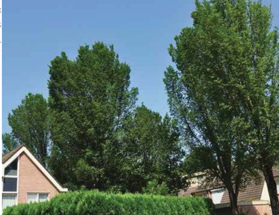
Iepen in Heerlense woonwijk met een gezonde populatie iepenpage-populaties zijn duidelijk te herkennen.

We weten nu ook waar de iepenpage zich het liefst