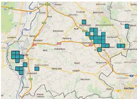
Waarnemingen van de iepenpage in Zuid-Limburg. De twee metapopulaties zijn duidelijk te herkennen.