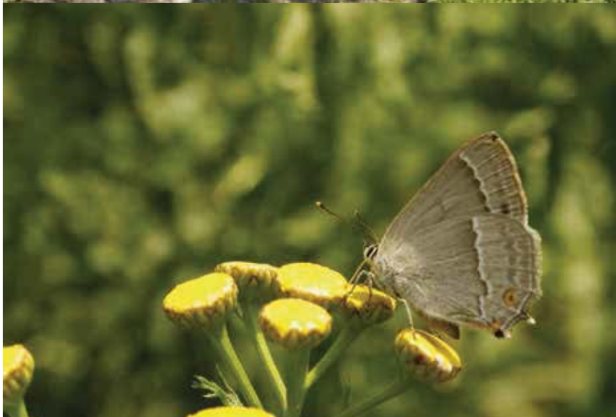
Eikenpage, op boerenwormkruid. Foto boven: pad in sectie 8 van de route.

zijdige' waarnemingen. Aan de boskant van het traject vliegen zelden vlinders.