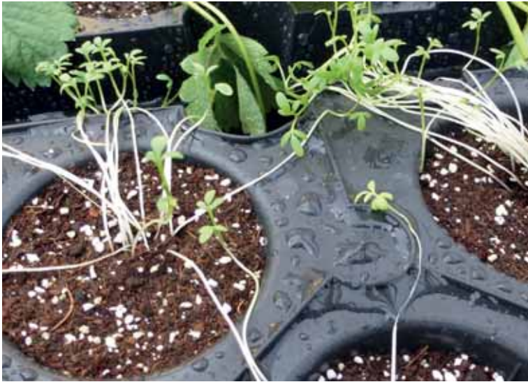
Tuinkers in substraat voorafgaand aan het stekken van de aardbeiplanten.

ziekteverwekkers. De tuinkers werd voor het planten afgeknipt. Ook hier gold weer dat er in de helft van de gevallen een goed resultaat werd geboekt. In 2014 viel het resultaat bij stek tegen. We hadden een hogere dichtheid tuinkers gebruikt dan in 2013, waardoor er ondanks het afknippen van de tuinkers concurrentie ontstond tussen de aardbeistek en de tuinkers. Mogelijk was dit de oorzaak dat de goede resultaten uit 2013 niet bevestigd werden in 2014.