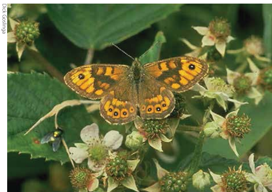
In de Vlinderberm heeft de argusvlinder zich tot 2003 goed gehandhaafd. Sinds 2010 lijkt hij echter hieruit te gaan verdwijnen.

De totale vegetatie wordt tweemaal per jaar gemaaid en na twee dagen wordt het maaisel