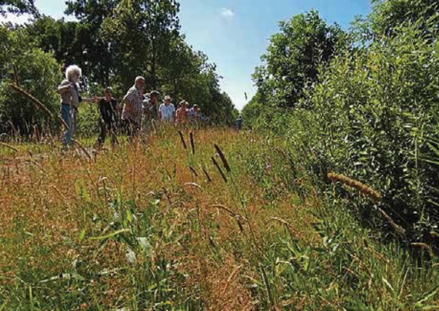
Excursie bij de presentatie van het rapport over de Vlinderberm op 19 juli 2013.

gekeerd, verzameld en afgevoerd. Dit vindt plaats aan de noordzijde van de berm langs de sloot. Doordat het maaisel enige dagen blijft liggen en pas daarna wordt verzameld en opgehaald, kan een deel van de aanwezige zaden en vlinderpoppen in de berm achterblijven. Door maaien en afvoeren wordt de vegetatie schraler en minder hoog en wordt de berm bloemrijker. Op den duur hoeft er mogelijk nog maar eenmaal per jaar gemaaid te worden. De berm moet echter niet té schraal worden, want dan gaat de bloemrijkheid weer achteruit. Enkele bloemrijke plekken met knooppkruid en een plek met grasklokje worden bij de juni-maaibeurt ontzien. In 2013 zijn ook enkele andere plekken met veel nectarplanten bij de september-maaibeurt overgeslagen, om de zaadval te bevorderen.