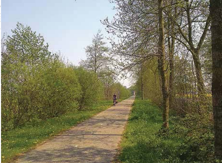
Het fietspad langs de Vlinderberm.

Zeker na de eeuwwisseling heeft de Wielenwerkgroep