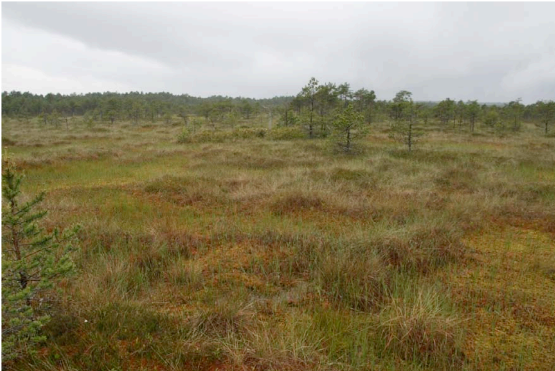
Afbeelding 3. Het centrale deel van het veengebied Järveküla