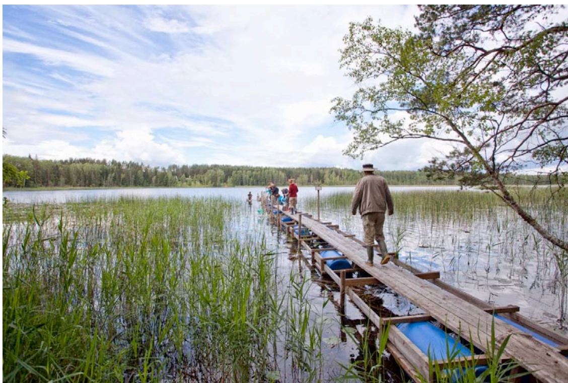
Afbeelding 4. Bemonstering van de submerse vegetatie in Viisjaagu järv

Het Viisjaagu järv leek grotendeels gevoed te worden door regenwater en kalkrijk grondwater. Aangezien de nabijgelegen huizen hun afvalwater niet direct op het meertje lozen en het grondwater zeer waarschijnlijk nutriëntarm is, wordt een lage belasting met voedingsstoffen verondersteld. Uit gesprekken met omwonenden bleek dat het meer een jaarlijkse peilfluctuatie van ongeveer een meter heeft. Er werden veel kranswieren (beslagen met kalk) in de submerse vegetatie aangetroffen (afbeelding 4). De soorten passen bij vrij hard, voedselarm water. Door het relatief lage aantal soorten werd betwijfeld of het meer 'goed' zou scoren op de Nederlandse maatlat. Terug in Nederland wees een berekening van de EKR echter uit dat deze twijfels ongegrond waren en dat de submerse vegetatie van het meer zelfs 'zeer goed' (0,9) scoort. De emerse vegetatie van het meer is goed ontwikkeld, maar haalt met een bedekking <75% geen 'goede' score. De macrofauna gaf een goed, maar soortenarm beeld, niet voldoende voor een 'goede' score naar Nederlandse begrippen. Een verrassende constatering dat de ecologie van dit meer, ondanks dat die zich in een uitstekende toestand bevindt (Voedselarm, helder, aanwezigheid van submerse en emerse vegetatie), op veel van de Nederlandse maatlaten dus onvoldoende zou scoren.