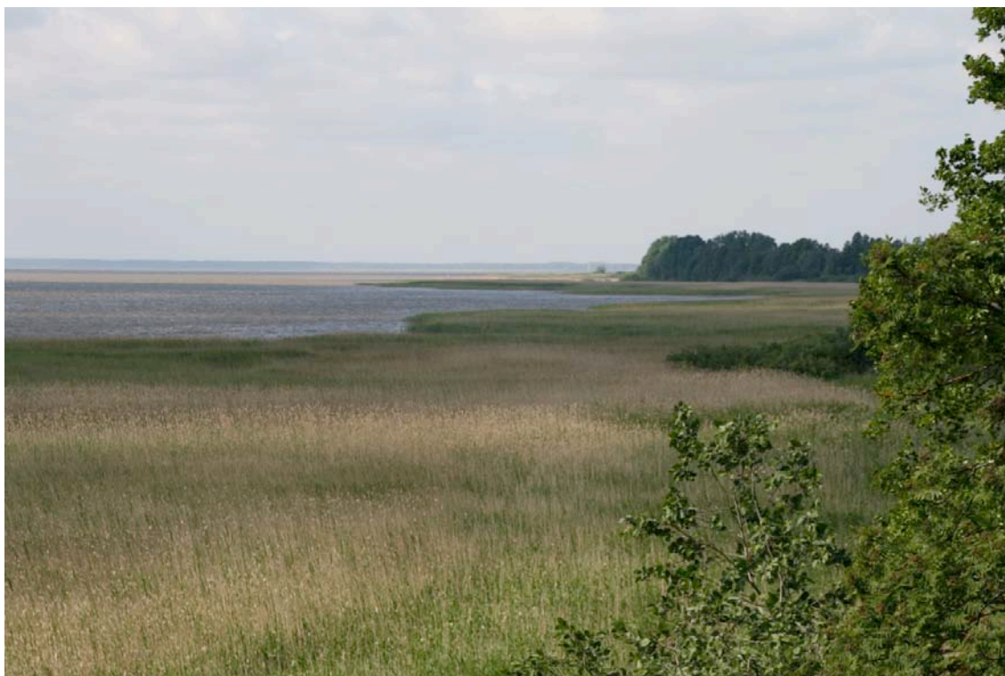
Afbeelding 1. Brede rietkragen langs Võrtsjärv

Dit op een na grootste meer van Estland, gelegen in het mid-zuiden, heeft een natuurlijke peilvariatie van 1,5 meter, waardoor de oppervlakte van het meer varieert tussen 237 en 326 km 2 (ofwel 23.700-32.600 ha). De gemiddelde diepte van dit meer bedraagt slecht 2,8 meter.