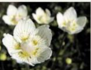
de parnassia is het een mooie zoner.