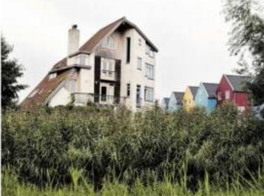
De bewoners krijgen van de gemeente geld voor het onderhoud aan het groen dat ze zelf uitvoeren.

maak eens in beweging te krijgen."... Het Makkebos kwijnt van de... werkwijze is dan niet goed. Wel... wordt er regelmatig gesproken over... samenwerking met andere wijken... waaronder het Culemborgse Terwijde... De buurt - bekend vanwege spin... ningra truien, Meibloes en Maank... kaarse haarbewoners - was afgewe... pen werkend nog in het meeren van... weg-onnati. "Het idee om samen te... werken is er een van de laatste jaren... Terwijde is een bijzondere wijk, so... meerwerken is een flinke uitdaging... Bewoners uit Terwijde maken wel al... in trekkende mate gebruik van de... voorzieningen hier", vertelt Rob... Vloering, bewoner en intermediair... tussen bewoners en gemeente.