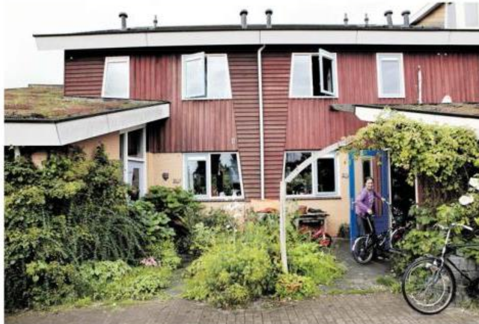
In de wijk EVA-Lansmeer is er in de voorste gralen geen afzetting tussen privatuinen en openbaar groen.