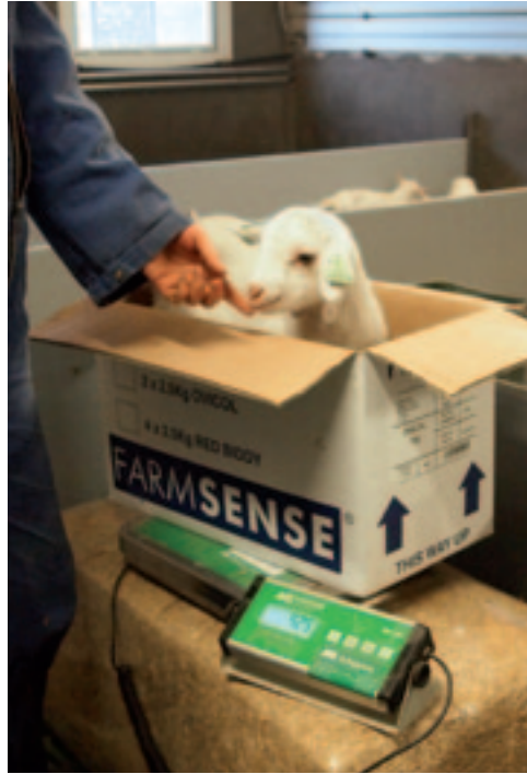
Een doos op de weegschaal werkt handig en kan na gebruik weggegooid worden.