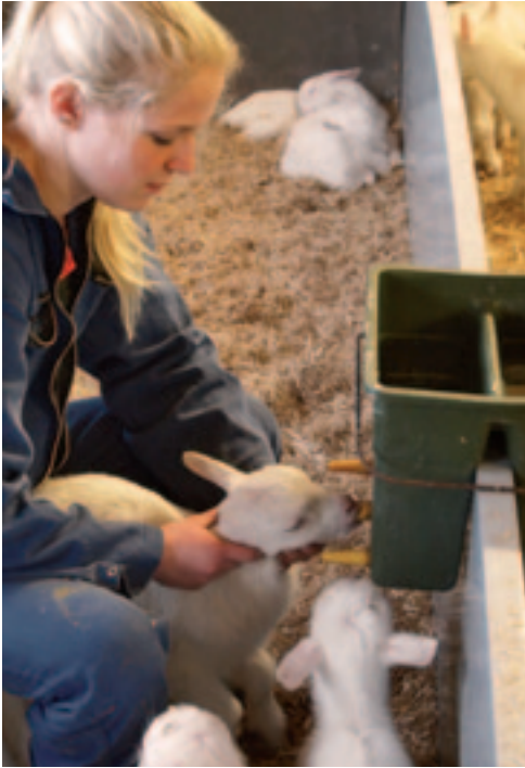
Het snel en goed aanleren van het drinken is belangrijk voor een goede groei.