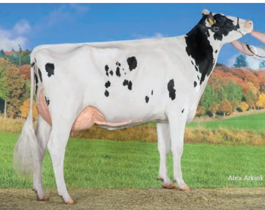
Watermolen Windbrook Paradise (v. Windbrook), kampioene vaarzen Prod.: 2.03 61 2450 3,79 3,03 lw 109 l.l.