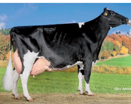
Wilhelmina 444 (v. Duplex), kampioene senioren Prod.: 4.02 445 16.998 3,66 3,43 lw 115