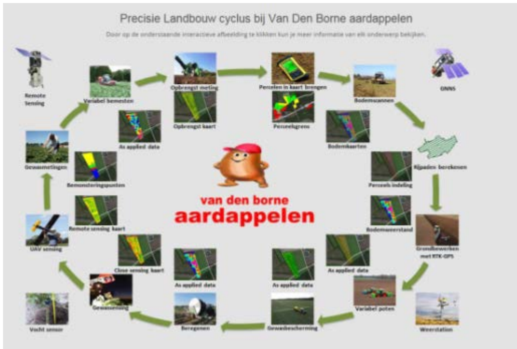
Figuur 1. Precisie Landbouw cyclus

Gerrit Massink poneerde de volgende stelling: GPS biedt voordelen bij het planten. Integratie van werkzaamheden op basis van GPS maakt GPS interessant voor de boomkwekerij. In figuur 2 staat aangegeven welke mogelijkheden hij zag.