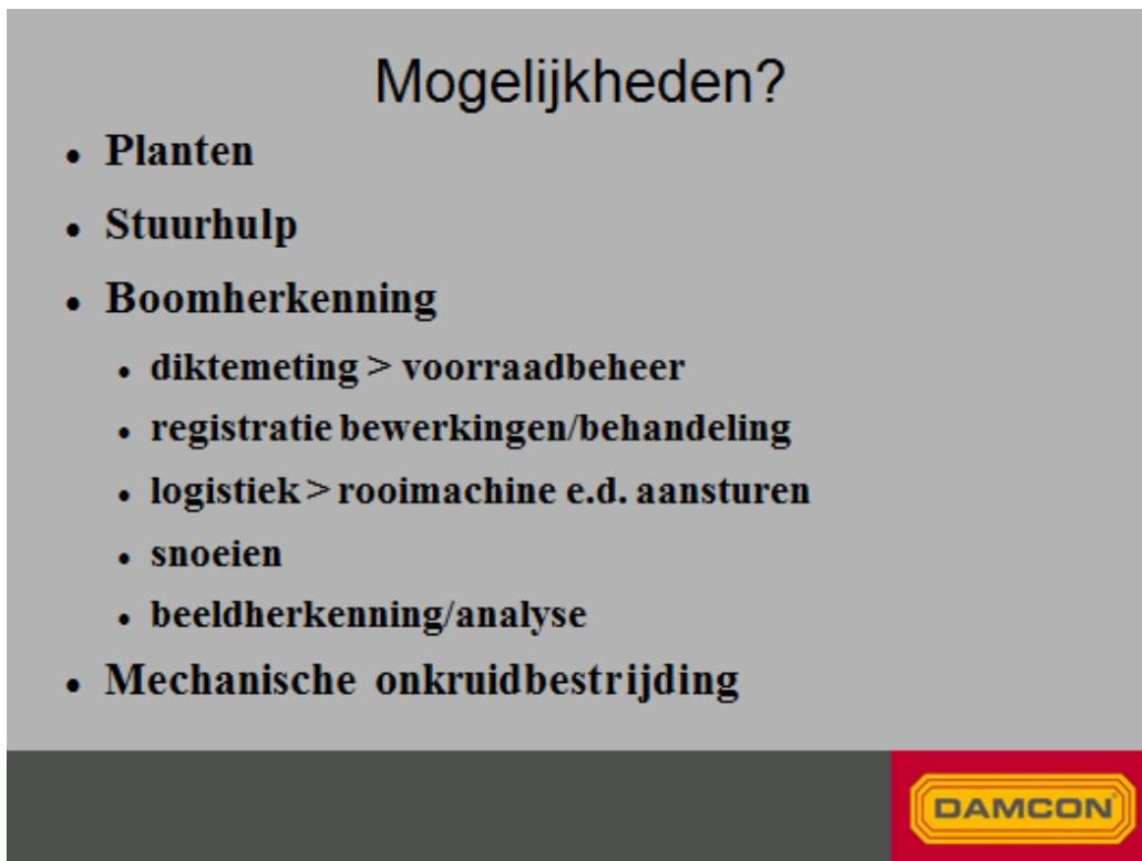
Figuur 2. Mogelijkheden GPS in de boomkwekerij.

Gerrit Massink poneerde de volgende stelling: GPS biedt voordelen bij het planten. Integratie van werkzaamheden op basis van GPS maakt GPS interessant voor de boomkwekerij. In figuur 2 staat aangegeven welke mogelijkheden hij zag.