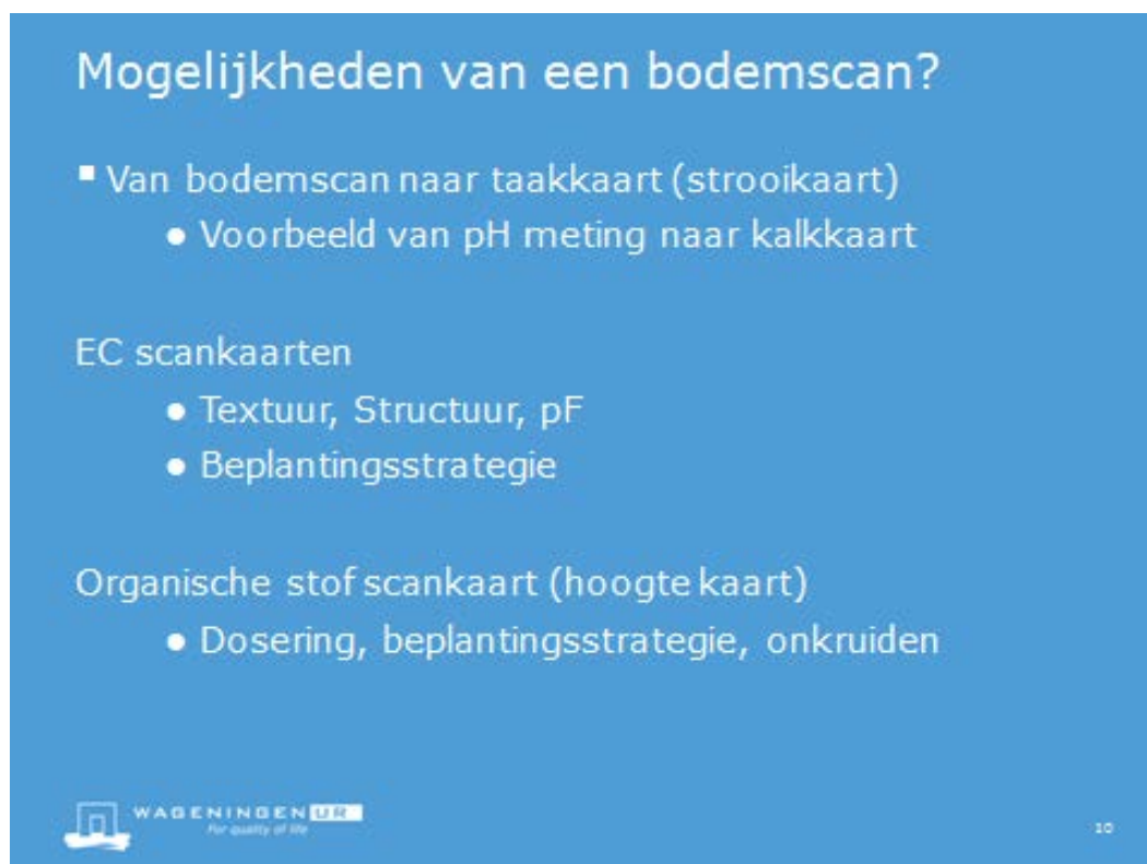
Figuur 3. Mogelijkheden voor een bodemscan in de boomkwekerij.

Ton Baltissen benoemde o.a. de volgende voordelen van een bodemscan: