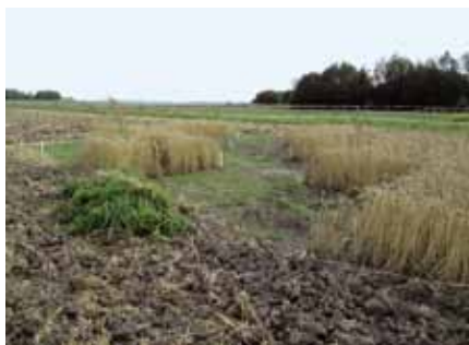
Foto 3. Wintertarwe op de Zonnehoeve.

fosforgehalte dan het gangbare buurperceel. Het is hierom waarschijnlijk dat bij decompositie van die organische stof ook meer fosfor vrijkomt. Dit is echter moeilijk te meten en in de gebruikelijke metingen van fosforbeschikbaarheid wordt mineralisatie uit organische bronnen dan ook niet meegenomen.