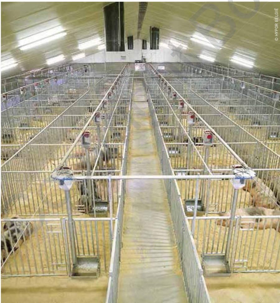
Zicht op de huisvesting van de Piétrainberen bij Hypor KI in Olsene.

“Gezien de eindbeer voor een groot deel bepalend is voor de rentabiliteit en de afzetmogelijkheden van de slachtvarkens moet deze keuze van eindbeer welover-