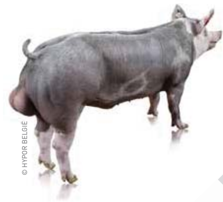
Sinds een halfjaar beschikt Hypor KI over sperma van de German Piétrain GenomPlus.

Door de uiteenlopende bedrijfsstrategieën van zijn klanten werkte Hypor de voorbije jaren aan een totaalconcept. “We bouwden de afgelopen 40 jaar een wereldwijde expertise op inzake de waardebeoordeling van Piétrainberen”, benadrukt Wim. “Piétrainberen zijn immers nog steeds de meest aangewezen eindberen voor de Europese markt. Maar ook binnen dit ras zijn er duidelijke genetische verschillen. De ene Piétrainbeer is de andere niet.