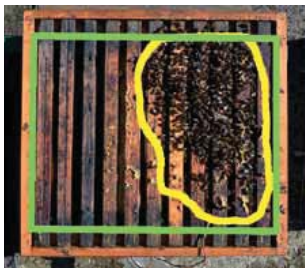
Figuur 1. Dekkingspercentage van de bovenkant van de kast. Het aandeel van bijen werd berekend door een lijn rondom de cluster bijen te trekken (ook de dieper zittende bijen) en de binnenkant van de kast; het aantal pixels van de bijen gedeeld door de pixels van de kast x 100% geeft het dekkingspercentage.

Het monitoren van de varroabesmetting om varroabestrijding op maat toe te kunnen passen, is mogelijk. Het is echter lastig en tijdrovend om dit echt goed en nauwkeurig te doen. In de zomer, wan-