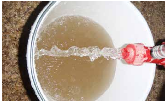
Vuיל spoelwater uit een drinklijn

Met dank aan: Gezondheidsdienst voor Dieren, Impex Barneveld B.V., JS Water, Schippers Bladel B.V. en 2 Sisters Storteboom B.V..