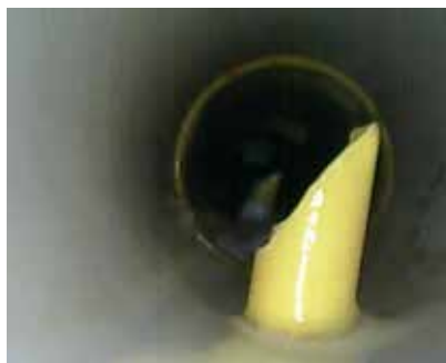
Links: vervuilde drinkleiding; rechts: schone drinkleiding