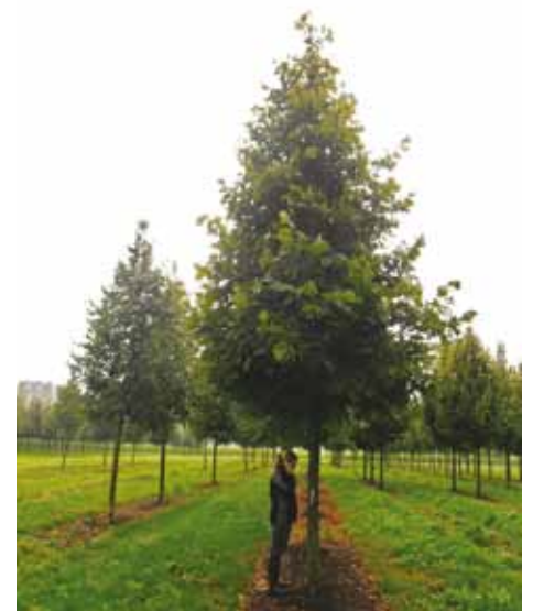
Tilia americana 'Nova'

Tilia x europaea 'Euchlora' neigt naar de tolerantie hoek: 'Euchlora' is toleranter dan 'Pallida',