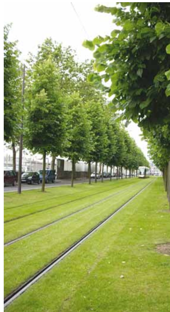
Tilia europaea 'Pallida'

Tilia henryana en Tilia mongolica zijn volgens de ervaringsdeskundige absoluut zuiver. Maar hier blijkt maar weer 'de juiste boom op de juiste plaats', want deze twee makkers kun je onmogelijk overal gaan aanplanten. 'Zowel Tilia henryana als Tilia mongolica kun je niet massaal in het openbaar groen aanplanten. Mongolica groeit bijna niet; elk jaar maar zo'n 30 centimeter. De blaadjes zijn 2 bij 2 centimeter. Het is eerder een parkboom, of leuk voor in een kleine tuin. Tilia henryana is te fijn, hij heeft een minder grote kroon en groeit ook weinig. Ze zijn duurder omdat ze op de kwekerij moeilijk te veredelen zijn en het lang duurt voordat ze zijn opgekweekt. Deze twee kun je dus onmogelijk als beplanting inzetten langs wegen en snelwegen, waar je als beheerder wilt dat de linde vlug de hoogte inschiet en volume krijgt. Neem in die gevallen gewoon een 'Greenspire' 'Böhlje', of 'Pallida'. Luizenbestrijding is op veel plekken langs wegen namelijk geen issue. Maar ook staan deze grote prachtige jongens prima in openbare ruimtes in de stad, natuurlijk mits daar geen