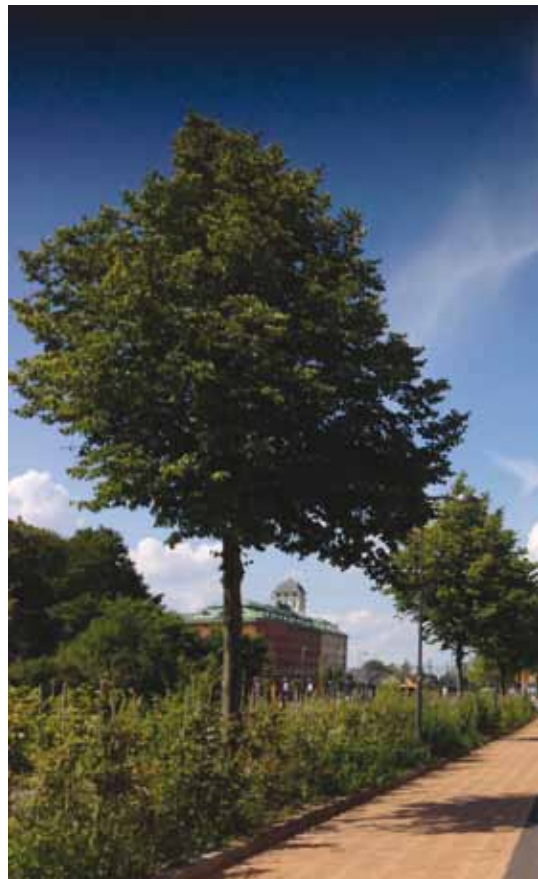
Tilia cordata 'Böhlje'