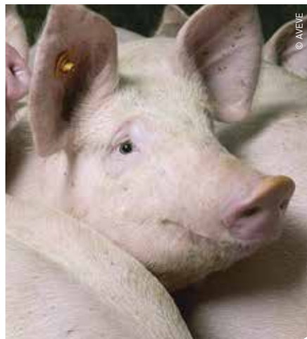
De bedrijfstak afmesting heeft in 2013 een familiaal arbeidsinkomen van 3,3 euro per afgeleverd vleesvarken. Dat is 6,7 euro minder dan in 2012.

De bedrijfstak afmesting heeft in 2013 een familiaal arbeidsinkomen van 3,3 euro per afgeleverd vleesvarken. Dat is 6,7 euro minder dan in 2012. Ook hier is er een verschil in brutosaldo van 15,1 euro per afgeleverd vleesvarken tussen de groep met het hoogste en het laagste brutosaldo. Het verschil is zowel toe te schrijven aan hogere opbrengsten (4,1 euro per afgeleverd vleesvarken meer) als aan lagere variabele kosten (-9,3 euro per afgeleverd vleesvarken minder). In tabel 1 wordt duidelijk dat de waarde per kg verkocht varkensvlees slechts lichtjes verschilt tussen beide groepen. De 50% bedrijven met een hoger BS halen wel een veel betere voederconversie (2,81 tegenover 3,11). De hoeveelheid krachtvoeder per afgeleverd vleesvarken ligt 8% lager bij de bedrijven