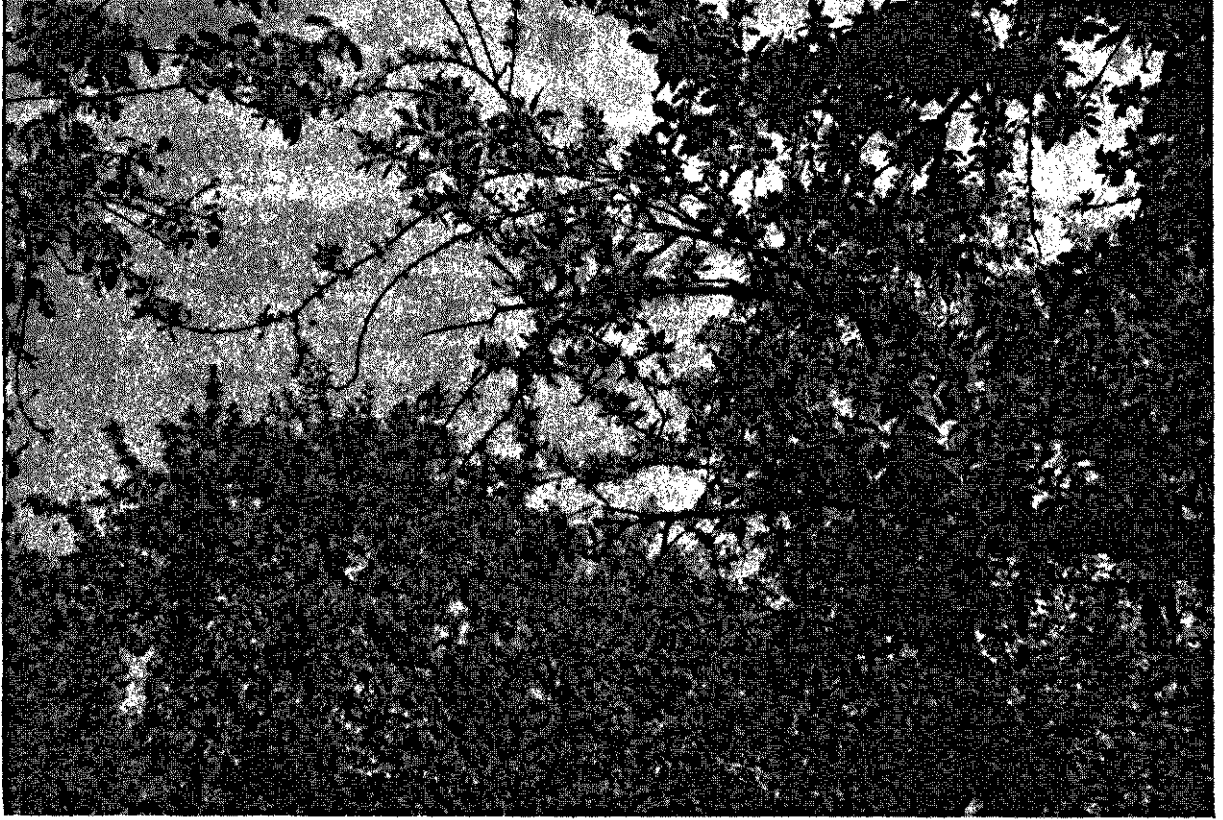
Zinkgebrek in de top van een oude appelboom op de voorgrond bovenaan. Achtergrond en voorgrond rechts normale groei