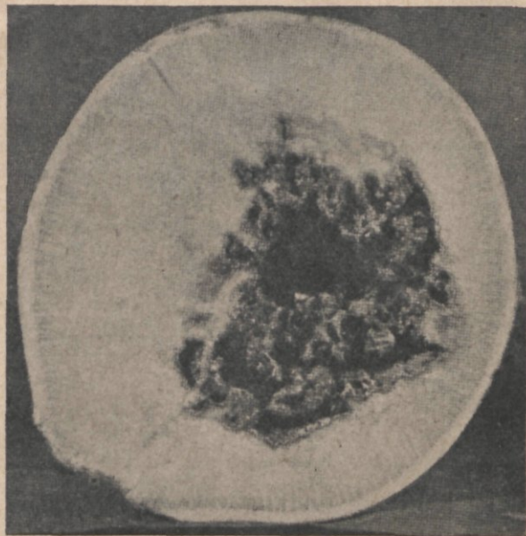
Boriumgebrek van koolraap Overgenomen uit "Trace elements in plants and animals" van W. Stiles

elementen slecht opneembaar. Behalve molybdeen zijn alle sporenelementen goed beschikbaar bij een pH van 6.5. Molybdeen is tot nu toe het enige sporenelement dat in zure grond slecht opneembaar is. Het zijn speciaal de elementen calcium, kalium en fosfor, die de opneembaarheid ongunstig beïnvloeden, wanneer zij in overmaat aanwezig zijn. Calciumovermaat bevordert een tekort aan ijzer, mangaan, zink en borium. Kaliumovermaat kan een tekort aan opneembaar borium eveneens in de hand werken. Overmaat aan fosfaten in de bodem vermindert de opneembaarheid van koper en zink. De sporenelementen beïnvloeden elkaar ook onderling: een overvloed aan opneembaar mangaan in de bodem bewerkt een ijzergebrek in de plant. In dit geval berust het ijzergebrek niet op het onopneembaar worden van ijzer in de bodem, maar op de overmaat mangaan in de plant, waardoor de juiste verhouding ijzer-mangaan in de plant verstoord is. Ook ijzergebrek ten gevolge van kalkovermaat in de bodem berust ten dele op een dergelijk verbroken evenwicht, ditmaal door een kalkovermaat in de plant. Het optreden van onoplosbare verbindingen van sporenelementen in de bodem hangt, behalve van de zuurgraad en de hoeveelheden van andere elementen, ook van de hoeveelheid kleideeltjes, de hoeveelheid humus en de aantallen micro-organismen af. Naarmate een grond zwaarder is, blijven de sporenelementen beter beschikbaar voor de wortels.