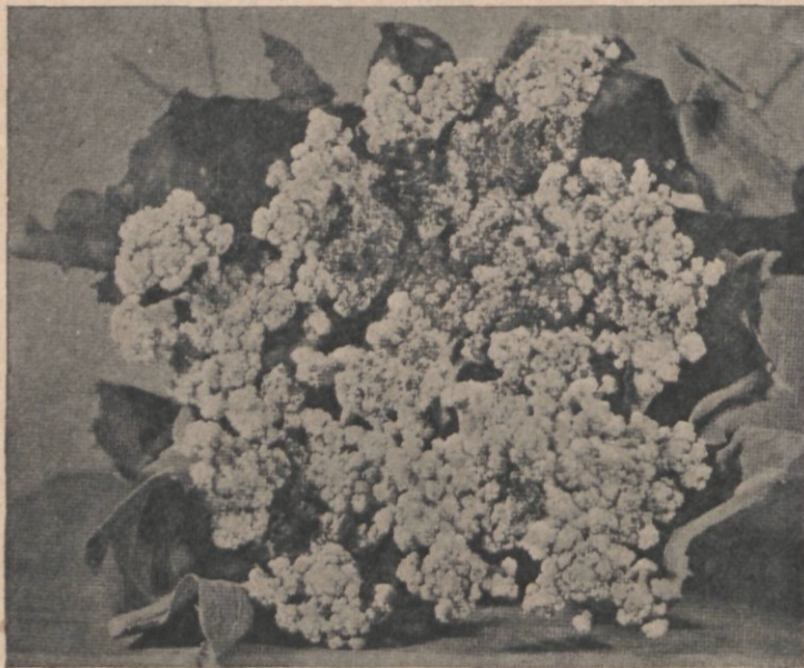
Boriumgebrek van bloemkool (Verkleuring van de bloemknoppen)