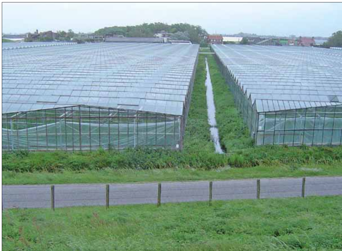
Uitzicht kassen en sloot