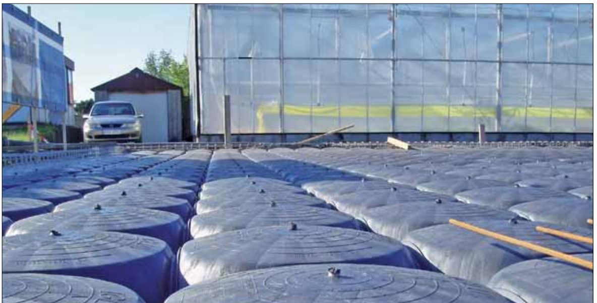
Het Watershell systeem van de kelder.

Bij het onderzoeken van het terrein is naast de gebruikelijke metingen, gekeken naar archeologie, flora en fauna, explosieven, grondmechanische en milieutechnische eigenschappen van de bodem en geohydrologie.