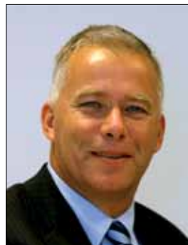
Theo Duijvestein wethouder gemeente Westland