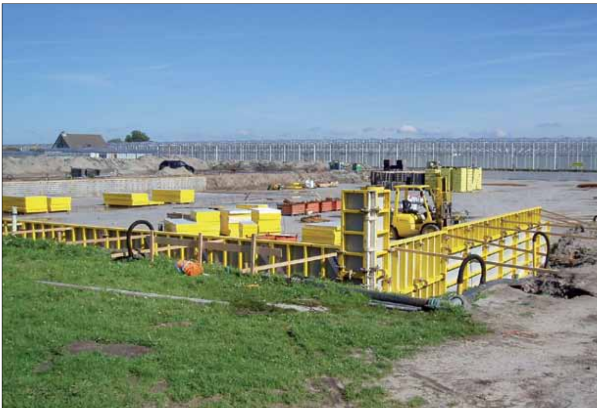
De bouw van de kelder in het Waalblok.