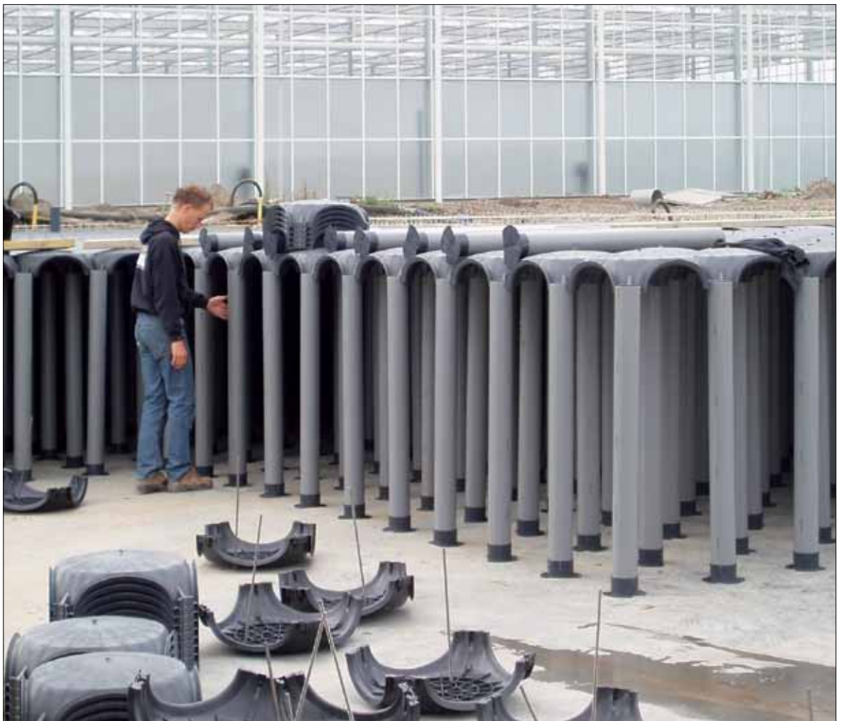
Aanleg bergingsvoorziening onder kassen

Bij het gebruik van de kelder moet zo veel mogelijk hinder worden voorkomen. Geurhinder is bijvoorbeeld een belangrijk aspect. In geval van oppervlaktewaterberging kan slib en ander vuil de kelder instromen. Dit slib en ander vuil kan geurhinder veroorzaken. Deze geurhinder kan worden voorkomen door het reinigen van de kelder na het gebruik als oppervlaktewaterberging. Om deze schoonmaak(en