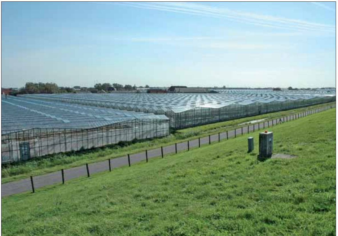
Zicht op Waalblok vanuit Arendsduin

In het Westland is de waterbergingsopgave groot: 525.000m 3 op circa 160 ha. Door de klimaatveranderingen zal dit probleem steeds groter worden, met grote gevolgen voor de glastuinbouw. Vanuit diverse overheden worden ook steeds strengere eisen gesteld aan de kwaliteit van het oppervlaktewater. In de nabije toekomst zullen er ook strengere eisen aan het gebruik van grondwater in de provincie Zuid-Holland worden gesteld. Ook de glastuinbouw stelt hogere eisen aan de beschikbaarheid en de kwaliteit van het water. Hiermee staat de glastuinbouw in het Westland in de komende jaren voor een tweetal behoorlijke wateropgaven.