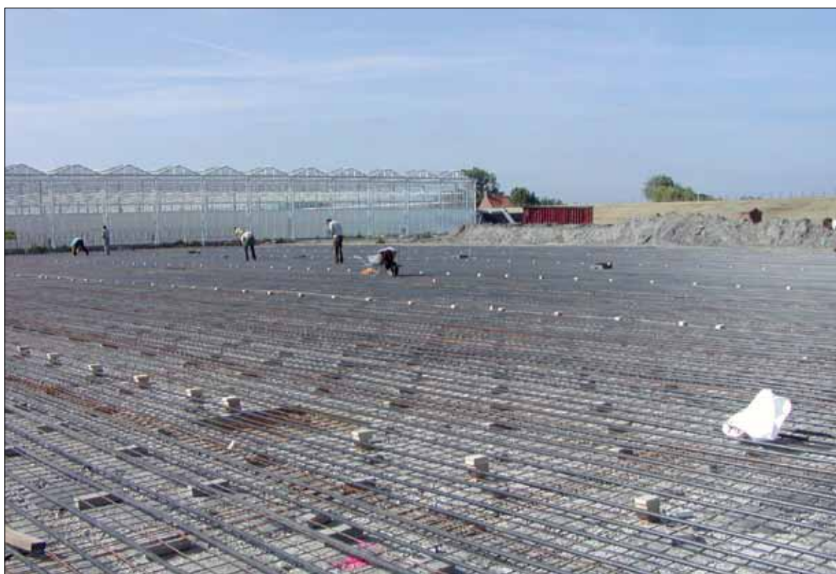
De waterbergingskelder in aanbouw.