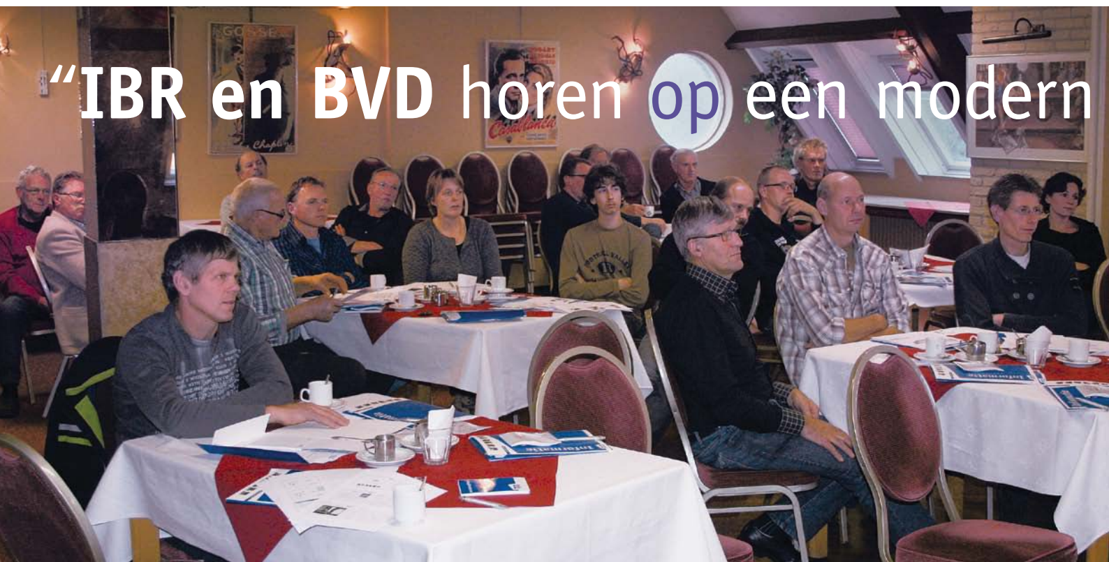
Tijdens de masterclasses was er veel ruimte voor vragen en discussie.

Kunnen vogels IBR overbrengen? Moet je een oorbiopt voor BVD-onderzoek nemen vóórdat het kalf biest heeft gehad? En als ik eenmaal ‘vrij’ ben, moet ik dan toch blijven enten? Melkveehouders vroegen de specialisten van de GD en MSD het hemd van het lijf tijdens de masterclasses IBR en BVD afgelopen najaar. GD Herkauwer was aanwezig in Alkmaar.