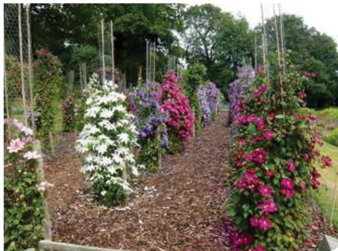
Wisley: Proeftuinen met o.a. Clematissoorten en -variëteiten

echter heel wat ouder. Nieuwe delen werden toegevoegd aan het oorspronkelijke park volgens de trends en stijl van de tijd zoals het pinetum (1907) en de rotstuijn (1911 en gerenoveerd in 2004). De bekende Britse tuinarchitecten Sir Geoffrey Jellicoe en Lanning Roper realiseerden in de jaren '60 de formele waterpartij en ommuurde tuinen voor het hoofdgebouw, uitgewerkt met passende sierplanten. Zo evolueerde de tuin tot een botanisch park met een prachtige plantencollectie en met ontelbare model- en proeftuinen. Relatief nieuw zijn de imposante serres (2007) die vooral educatief opgevat zijn.