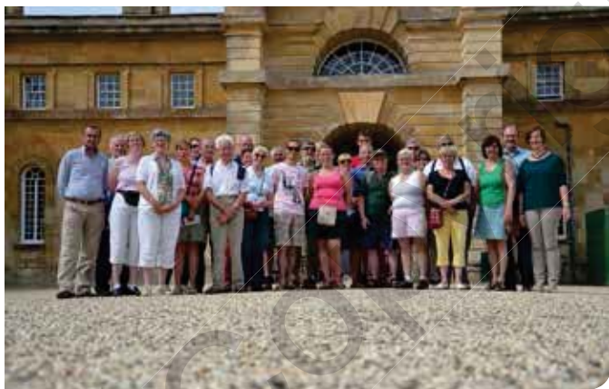
De leden K.H. Sint-Fiacre bij Blenheim Castle

Naar aanleiding van het lustrum van 125 jaar K.H. Sint-Fiacre organiseerde deze West-Vlaamse beroepsvereniging voor sierteelt en tuinaanleg tussen 19 en 21 juli een studiereis naar Groot-Brittannië. Daarbij werden een aantal iconen van de Britse tuin- en landschapsarchitectuur bezocht. Naast de tuinen van Wisley werd een bezoek gebracht aan Blenheim castle, Hidcote Manor en Oxford.