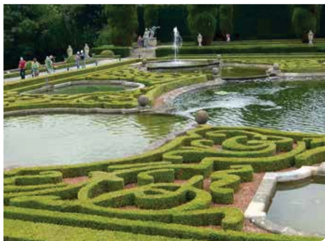
Blenheim: Formele Watertuin bij het kasteel naar ontwerp van landschapsarchitect A. Duchêne

Blenheim is al generaties lang het thuisfront van de krijgsheren en hertogen van Marlborough. Ook Sir Winston Churchill was lid van de familie. Blenheim is een historisch paleis met aangepaste