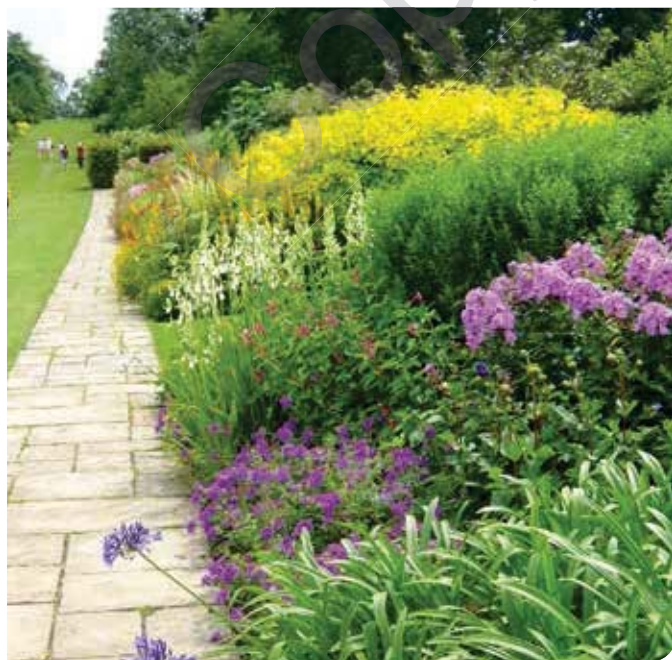
Wisley: klassieke vaste plantenborders