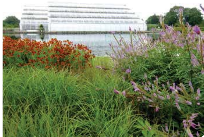
Wisley: Vaste planten border aan het nieuwe serrencomplex naar ontwerp van Piet Oudolf

Alle tuinen, van de grote landschapsparken tot de kleine cotta-geuntjes, hebben hun eigen verhaal waarin vooral adel, maar ook geestelijken, boeren en burgers een belangrijke rol spelen. Sommige tuineigenaars erfden de tuin van hun voorouders die er al generaties lang woonden. In deze tuinen vindt de tuinliefhebber een stukje sierteeltgeschiedenis. Maar veel van deze tuinen en landgoederen werden overgenomen door de National Trust en konden zo overleven. Deze National Trust for Places of Historic Interest or Natural Beauty, is een charitatieve instelling opgericht in 1895, met als doelstelling het behoud van belangrijke historische buitenplaatsen in Engeland, Wales en Noord-Ierland. In Schotland bestaat een gelijkaardige maatschappij, namelijk de National Trust for Scotland. De National Trust is volkomen onafhankelijk van de overheid. Het inkomen bestaat uit entreegelden, abonnementen van de 3½ miljoen leden, donaties en legaten en de winst van commerciële nevenactiviteiten. Het dagelijks werk is grotendeels in handen van meer dan 42.000 leden en vrijwilligers. De instelling heeft bezittingen op letterlijk duizenden locaties, zoals 350 historische huizen, tuinen, fabrieken en molens, waar ze jaarlijks 14 miljoen betalende bezoekers ontvangt. Deze respectabele trust beheert bossen, moerassen, meren, eilanden, stranden, akkers en weiden evenals archeologisch erfgoed. De totale oppervlakte van het onroerend goed van de National Trust bedraagt 2.520 km 2 , dat is bijna 1,5% van