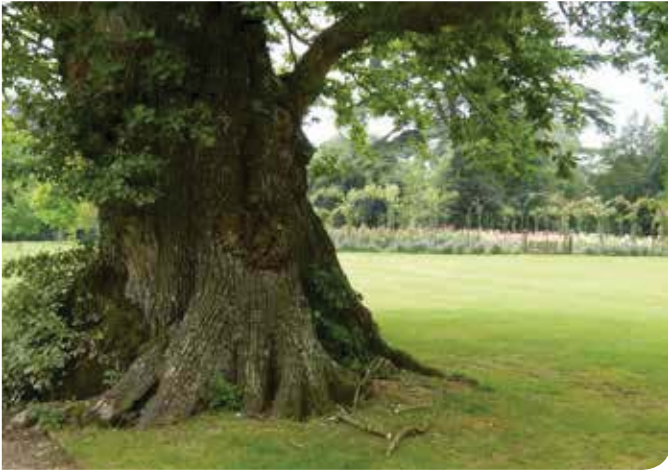
Blenheim: Eeuwenoude monumentale bomen in arboretum bij het rosarium

tuinen die gesticht werd in 1705. We zien hier dan ook vooral een landschapspark met een oppervlakte van 800 ha met bijhorend meer, rivier, een waterval, romantische bruggen en obelisk