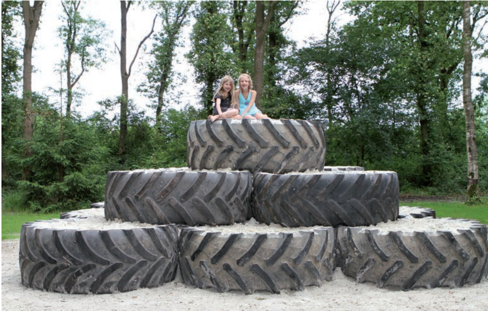
In het bos dat bij de camping hoort is een zandspeeltoestel gemaakt van opgestapelde trekkerbanden.

liter melk maken we zo'n veertig liter ijs. In onze winkel gaan er 's zomers zo'n 400 ijsbekers doorheen." Klanten zijn niet alleen campinggasten, maar ook wandelaars en fietsers die de boerderij passeren. Daarnaast levert het echtpaar af en toe op bestelling vers ijs aan groepen. Sinds drie jaar hebben ze ook boerensoftijs in het assortiment. "Dat is niet alleen erg lekker, maar ook makkelijk", zegt Lucie. "Vanuit de ijsmachine draaien we het ijs direct via een spuitmond in een hoorntje."