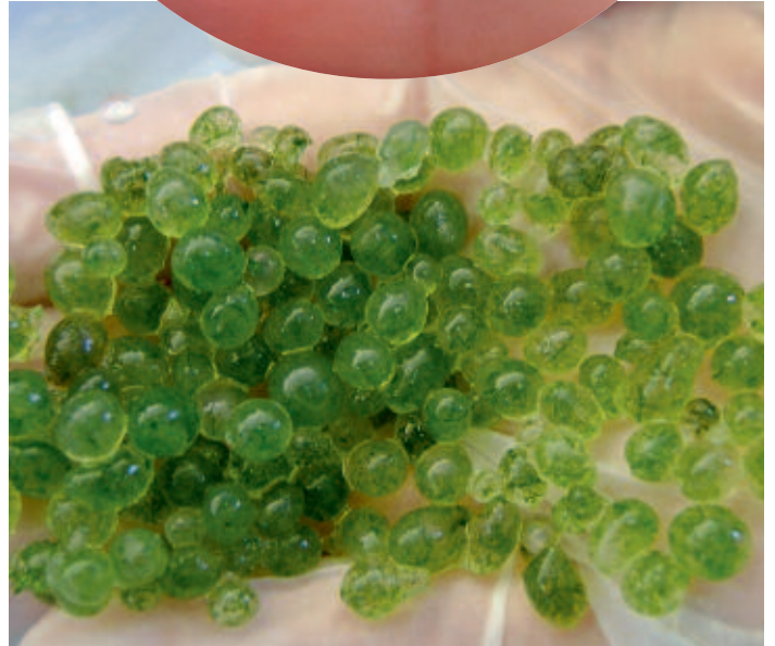
Foto 2. Veenmosbeads zijn gelparels met daar in jonge veenmosplanten ( www.beadamoss.co.uk ). Inzet: ontspruitende veenmosplanten uit een gelparel. In Groot-Brittannië worden deze gebruikt voor het herstel van afgegraven hoogvenen; in het Ilperveld testen we ze op voormalige landbouwgrond. Het gaat daarbij om Sphagnum fallax , S. palustre , S. fimbriatum , S. squarrosum en S. subnitens.