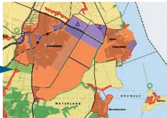
Mogelijke ontwikkelingen ná 2020