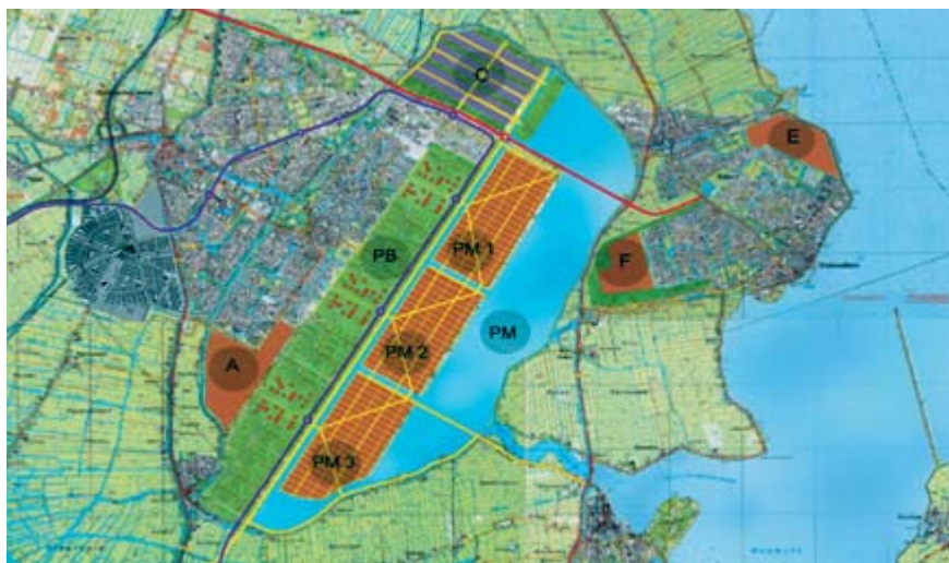
Plan Dijkstra-concentratie van 30.000 woningen in de Purmer Meer