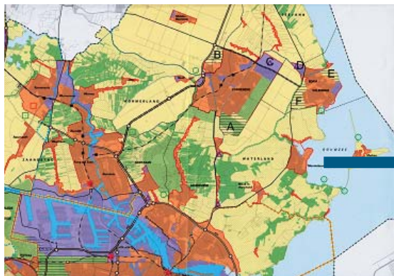
Ontwikkelingen tot 2020 volgens het Ontwerp Streekplan Noord-Holland Zuid