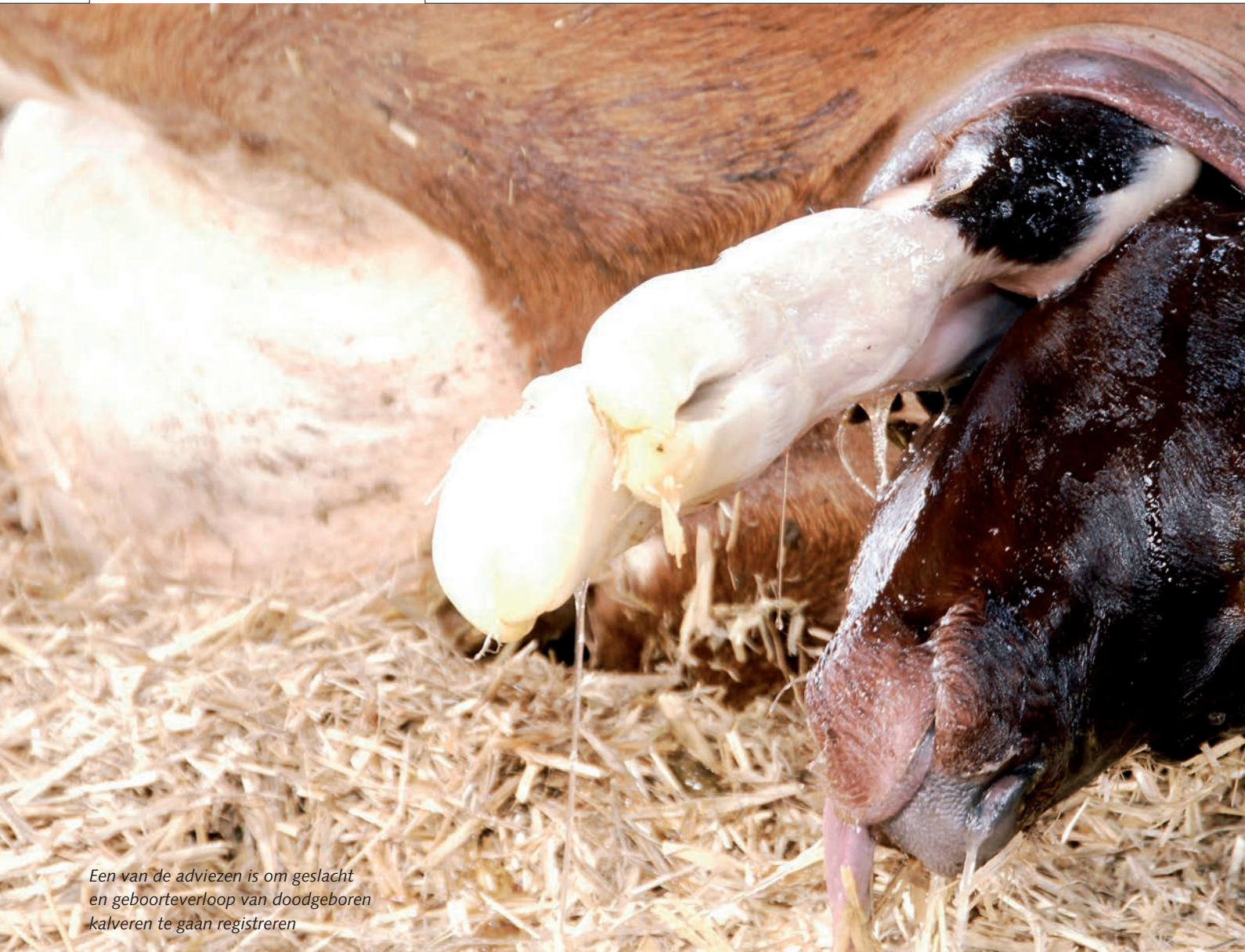
Een van de adviezen is om geslacht en geboorteverloop van doodgeboren kalveren te gaan registreren

neemt toe met de mate van inteelt. Bij het combineren van halfbroer en halfzus daalt de levensvatbaarheid bijvoorbeeld een paar procent. Bij de toename van vijf tot tien procent inteelt is er hooguit sprake van één procent meer doodgeboorten.'