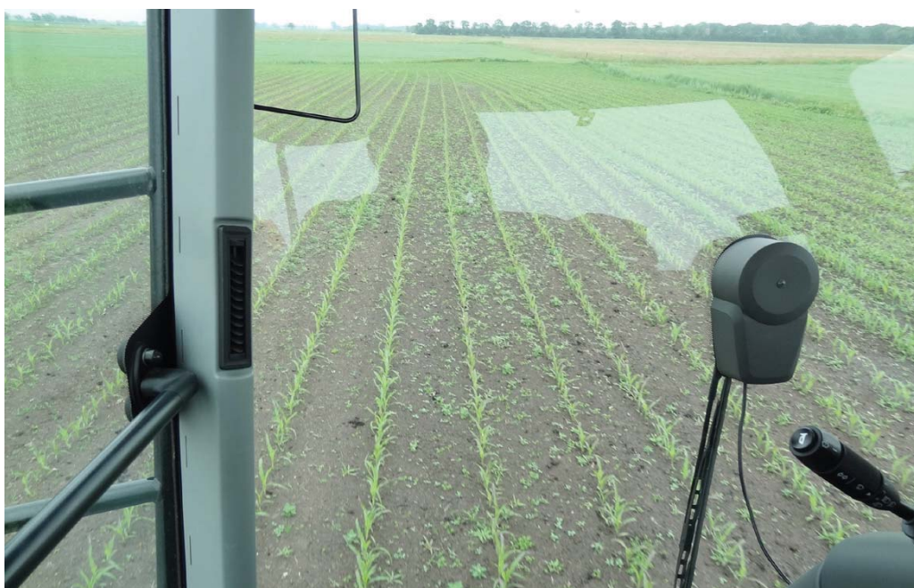
Door in een vroeg stadium te spuiten, is de kans op gewas en dus groeischade het kleinst