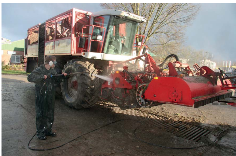
Wind mee: de druppeltjes met fijnstof waaien van u af.