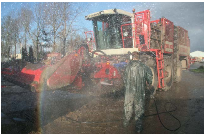
Wind tegen: de druppeltjes met fijnstof waaien op u af. U wordt vuil vanbinnen en vanbuiten. Draai de machine even om, want dan ademt u geen nevel in.

De foto's bij dit artikel zijn onderdeel van de toolbox 'Stoflongen'. Om de hele toolbox te bekijken, ga naar het dossier 'Toolboxen' op www.cumela.nl .