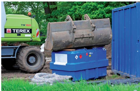
Om diefstal tegen te gaan, wordt vooral de IBC afgeschermd, zoals hier door er een bak op te leggen...