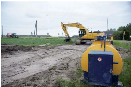
Die diefstal van brandstof van onbeveiligde opstelplaatsen is één van de grootste schadeposten voor bedrijven.