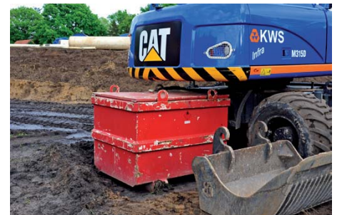
...of hier door de IBC tegen de machine en onder het contragewicht te plaatsen. De diesel in de opslag is in elk geval onbereikbaar.