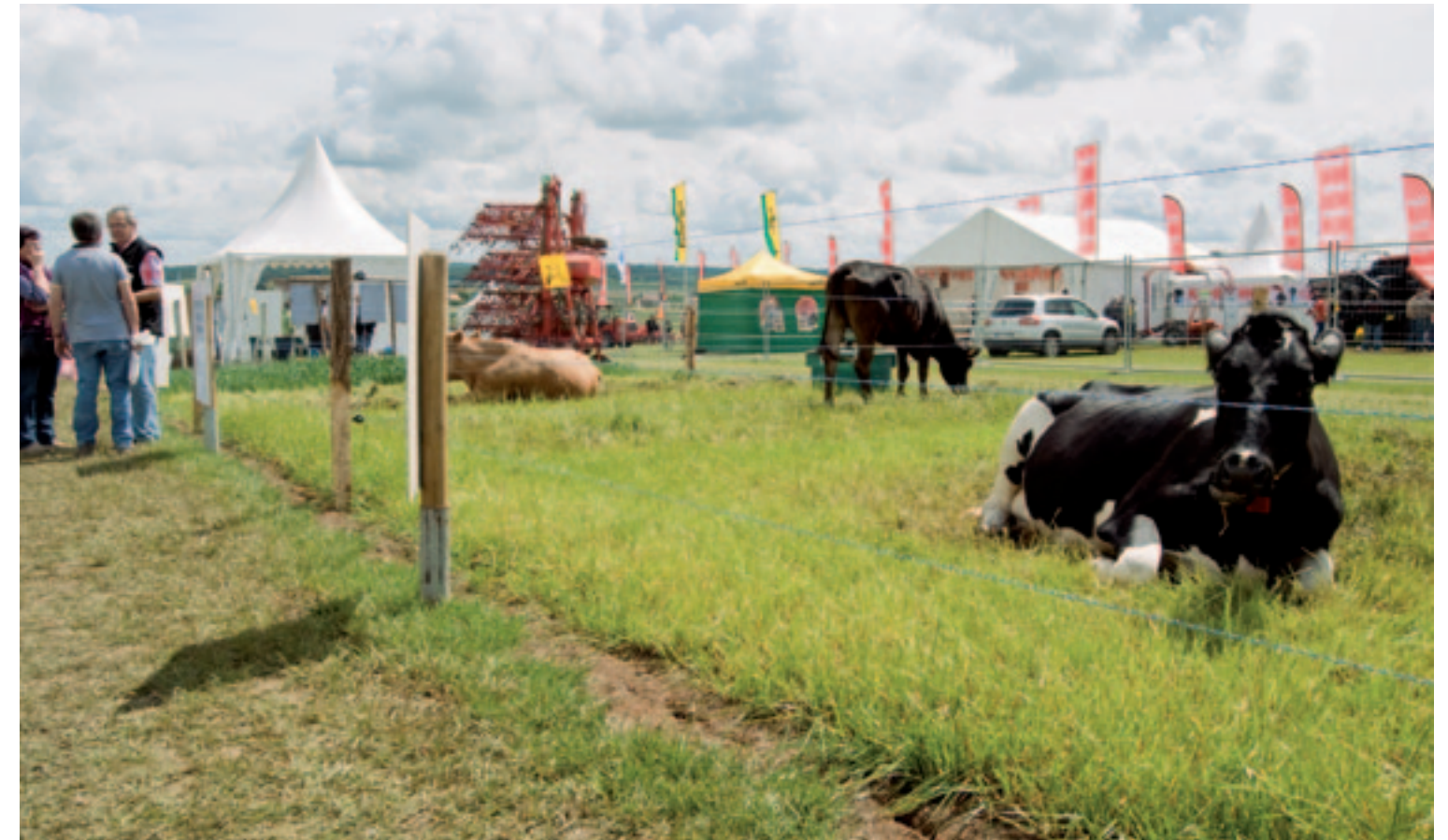
Weiden, hooien, voeren

op deze beurs. De organisatie ziet graag internationale gasten, maar Engels- of Duitssprekende standhouders zijn een zeldzaamheid, ook op stands waar onderzoekers, onderwijzers en studenten het woord doen. Putten uit de op het oog rijke graslandervaring van de Fransen is dus niet makkelijk voor wie geen Frans spreekt. Desalniettemin, de beurs is geweldig opgezet en buiten de taalbarrière gastvrij. Je loopt hem graag nog eens af. Dankzij de lange beursstraat mis je niks en raak je de weg niet kwijt.