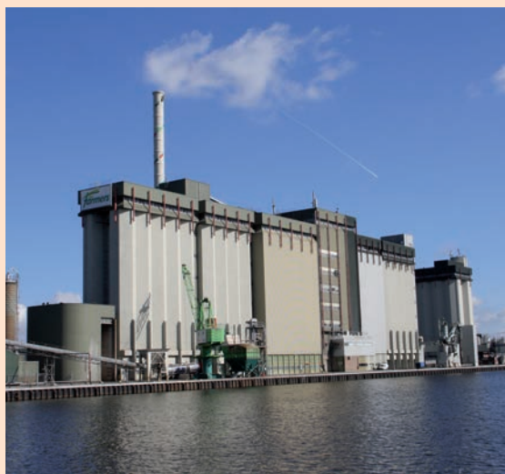
Schaalvergroting biedt een bredere basis voor kennis- en productontwikkeling, stelt ABN Amro.

"Schaalvergroting biedt een bredere basis voor investering in kennis- en productontwikkeling", aldus de bank. ABN Amro stelt verder vast dat bij het afnemen van de binnenlandse markt, verdere groei moet worden gezocht buiten Nederland, via fusies of overnames. "Maar schaalgrootte is niet de enige succesfactor", stelt de financiële dienstverlener. "Product- of marktspecialisatie, regionale binding, toegankelijkheid en persoonlijke benadering kunnen eveneens het verschil maken, met name voor kleinere en middelgrote bedrijven."